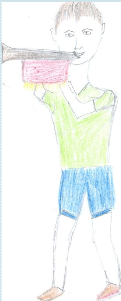
Пионер. Автор: Бессмертный Вова 1 класс

Итогом посещения музея должно быть самостоятельное творчество детей : рисунок, сочинение на тему