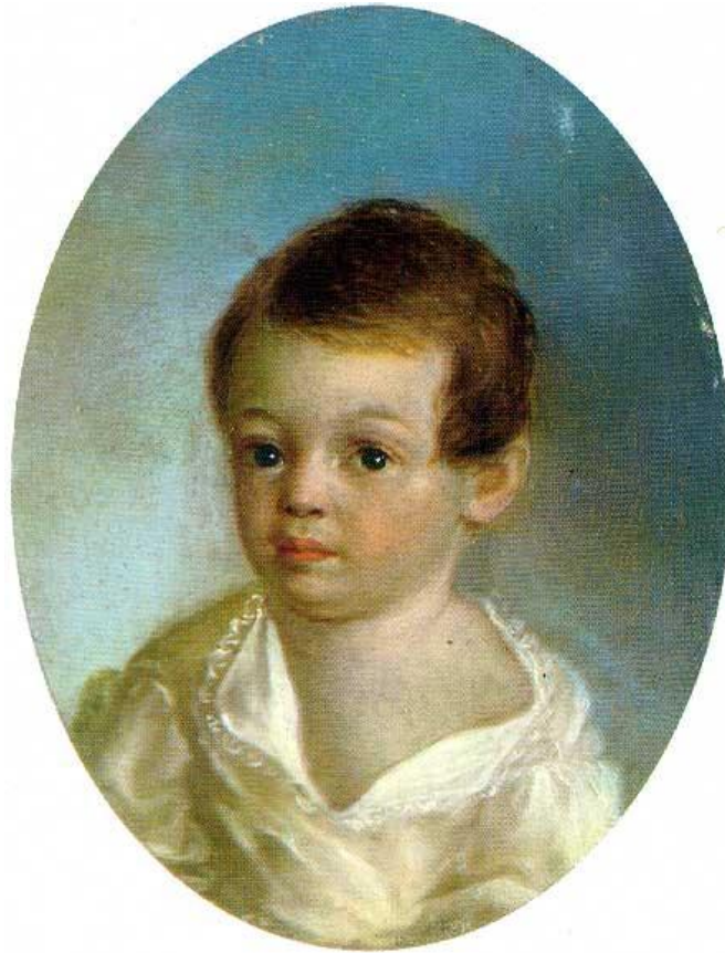
Пушкин-ребенок (1800-1802 гг.)