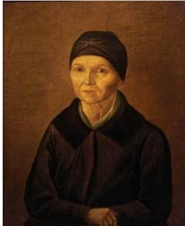
Няня, Арина Родионовна Яковлева (1758-1828 гг.)

Плоды своих мечтаний И гармонических затей Читаю только старой няне, Подруге юности моей.