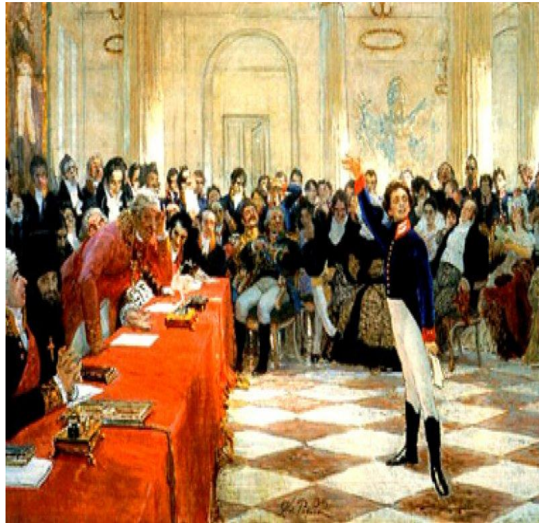
«Воспоминание в Царском селе»