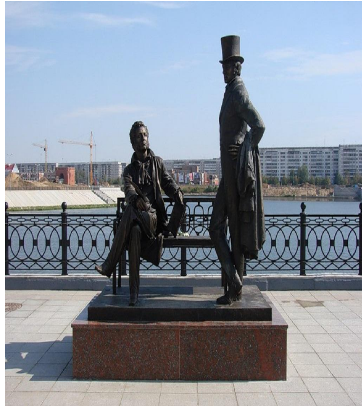
Памятник А.С.Пушкину и его герою Онегину в Йошкар-Оле.