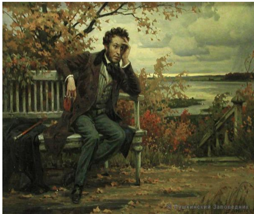
Село Михайловское (1824-1826 гг.)