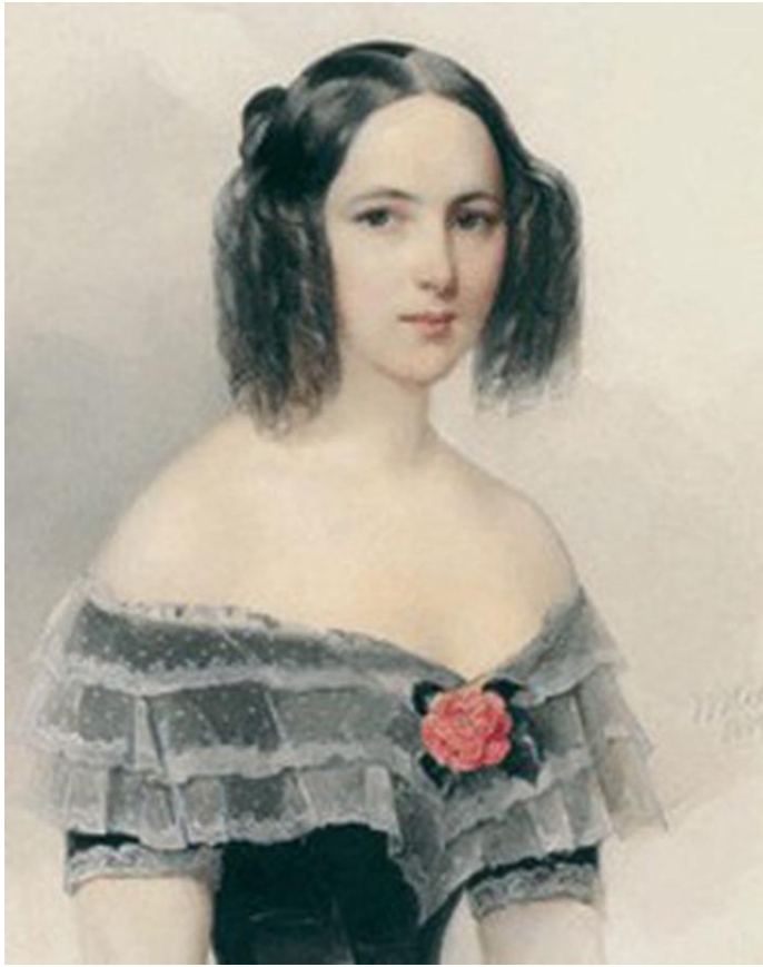
Наталья Гончарова (1812-1863 гг.)