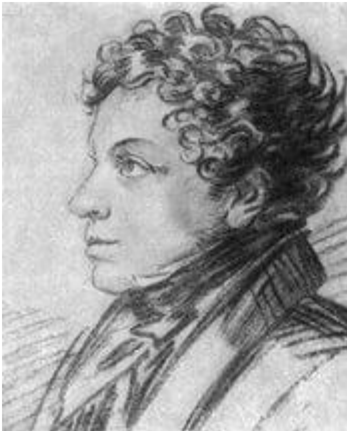
Брат, Лев Сергеевич Пушкин (1805-1852 гг.)