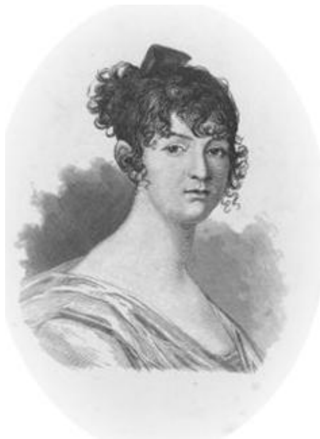
Надежда Осиповна Пушкина (1775-1836 гг.)