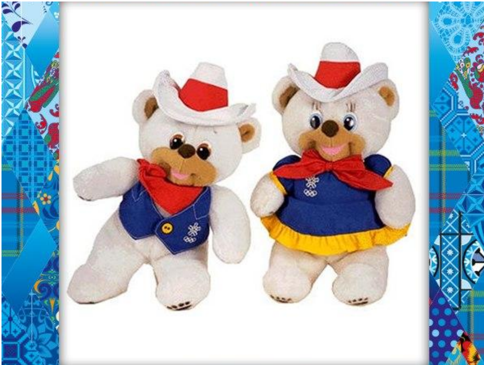
Полярные медведи: Хайди и Хоуди