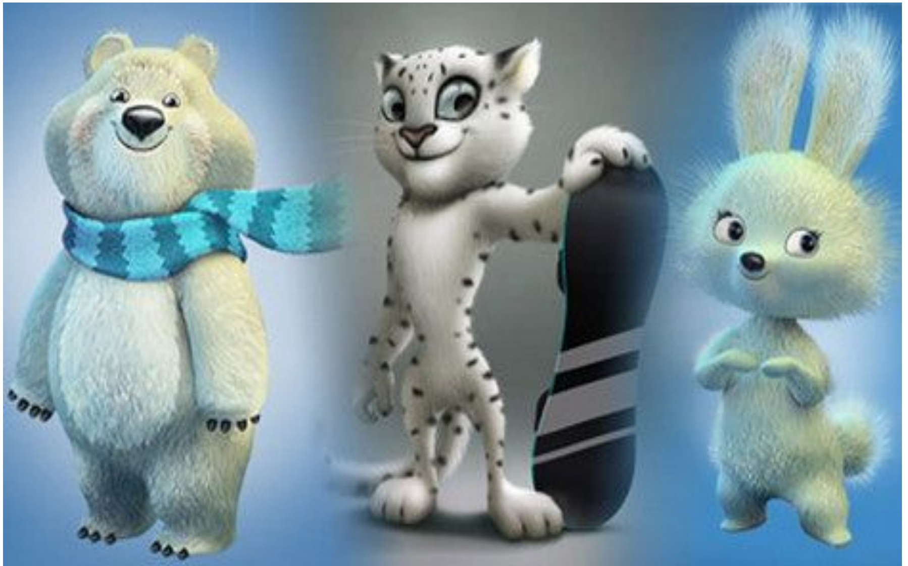
Белый медведь, Леопард и Зайка