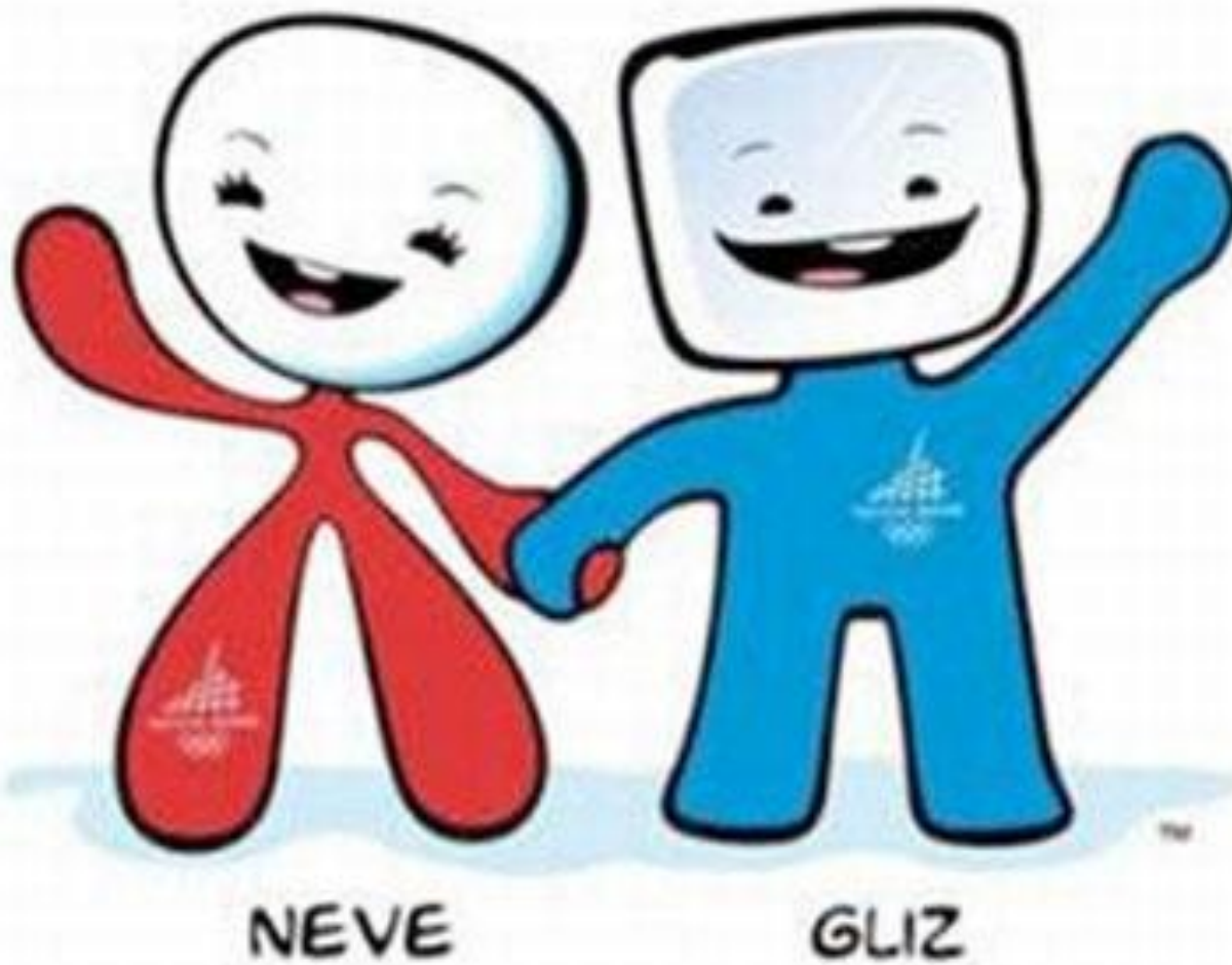
Девочка- снежок Неве и кубик льда Глиц