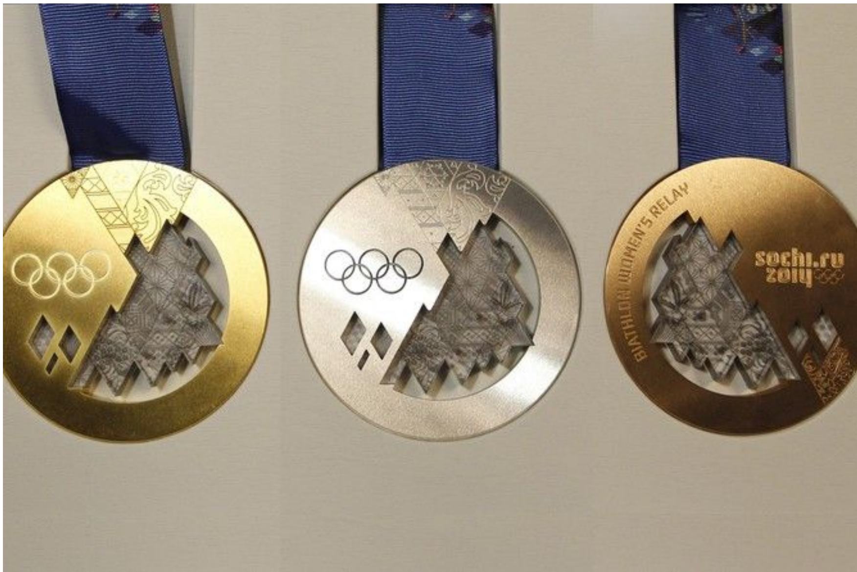
Олимпийские медали Олимпиады в Сочи 2014 года