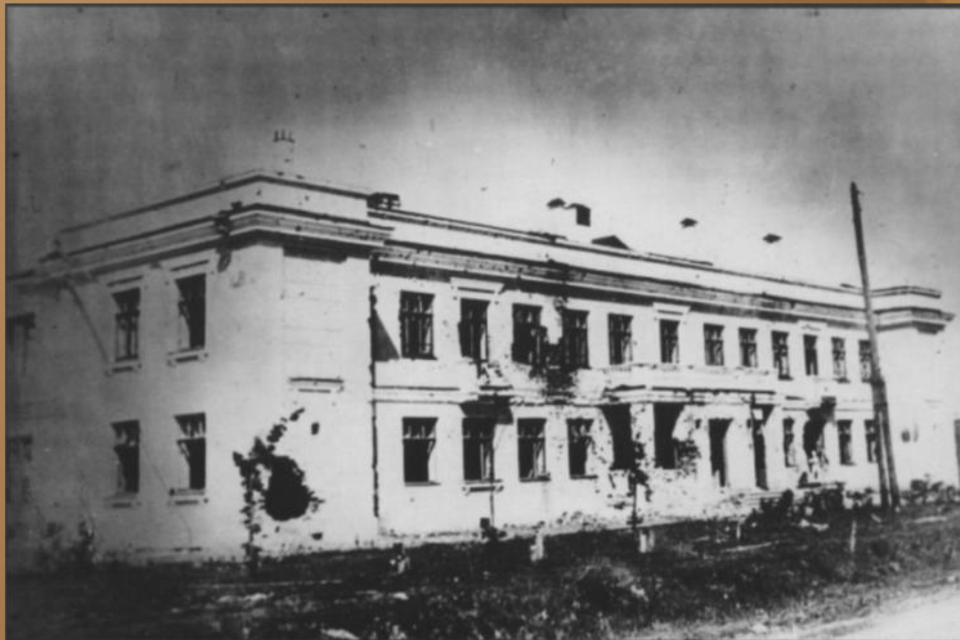
Здание детских яслей на улице Парловской. 1942 г.