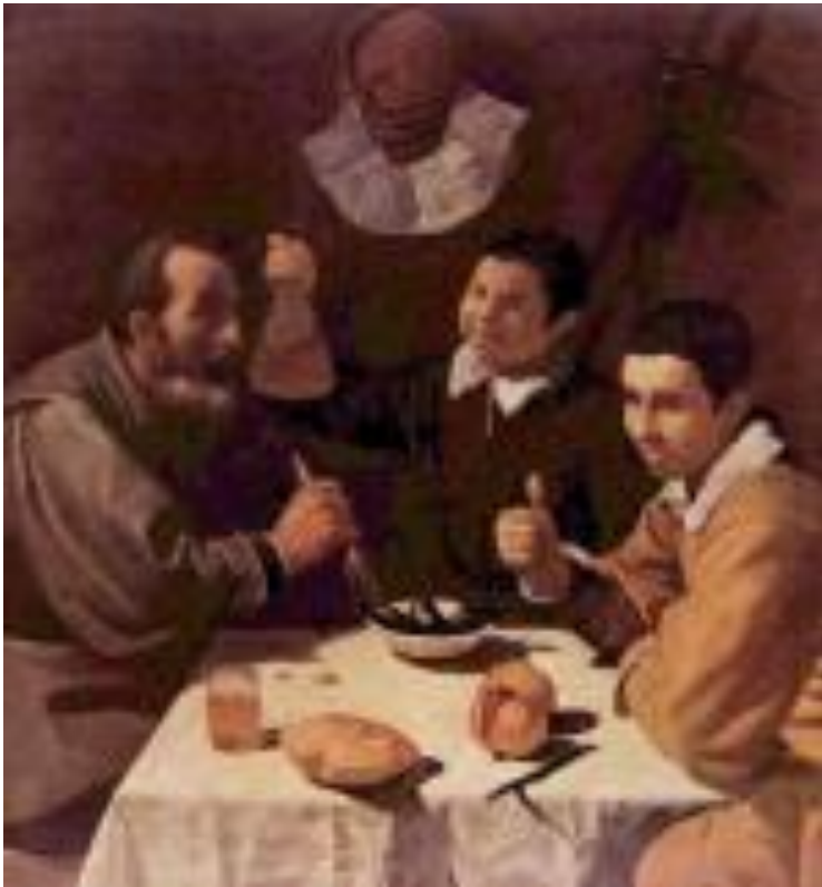
«Завтрак». Около 1617-1618 г.

Слово « бодегон » первоначально означало винный погребок или таверну, место, где можно было получить самую простую пищу – вино и хлеб. Безусловно , в Севилье, где прошло детство и юность Диего Веласкеса , были такие таверны. Но со временем, этим словом стали называть и картины, на которых изображалась подобная трапеза. Эту картину художника по структуре построения часто сравнивают с иконой « Троица» Андрея Рублёва. Персонажи вкушают хлеб и вино - символы плоти и крови Христа.