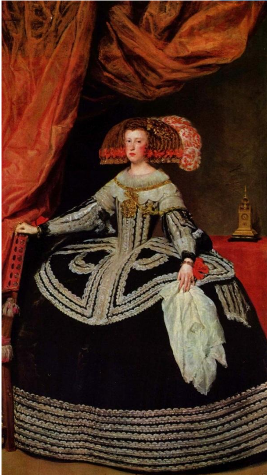
Портрет Марианны Австрийской .1652 г.

При испанском дворе не любили вторую жену короля Филиппа IV . Её называли «своенравной немкой». На портрете королева изображена в платье с широкой юбкой ( «гвардаинфанта»). Причёска состоит из плотно уложенных, туго завитых прядей волос ( своих и накладных) и большого количества украшений- перьев, бантиков, драгоценностей.