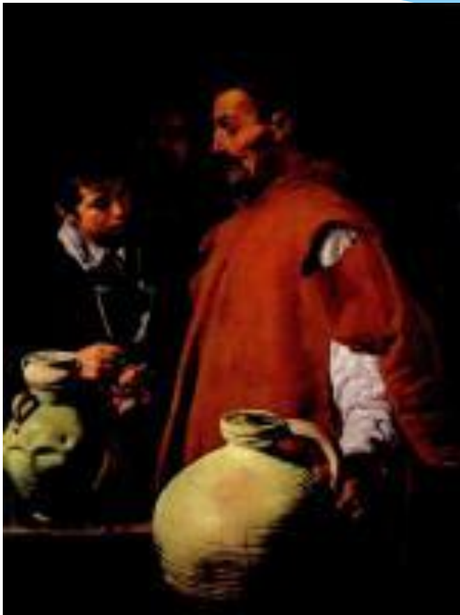
«Севильский водонос »1620 гг.

Творчество великого испанского живописца Диего Родригеса де Сильва Веласкеса (1599 -1660) относится к эпохе барокко. Веласкес родился в 1599 году в богатом - испанском городе Севилья.