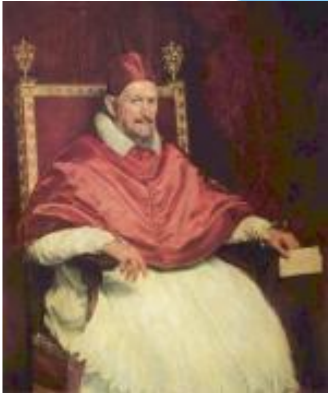
Портрет папы Иннокентия X.1650 г.

После написания портрета папы римского Иннокентия X, Веласкес был принят в члены академии святого Луки. Портрет он писал опираясь на композицию портрета папы Юлия II кисти легендарного Рафаэля. Но по содержанию художник написал совсем иной портрет. Лицо папы необычайно живое, кажется, то отталкивающим, то напротив, приятным. Несомненно одно - оно притягивает зрителя. Рассказывают, что сам папа, увидев свой портрет сказал: « Слишком похож !»