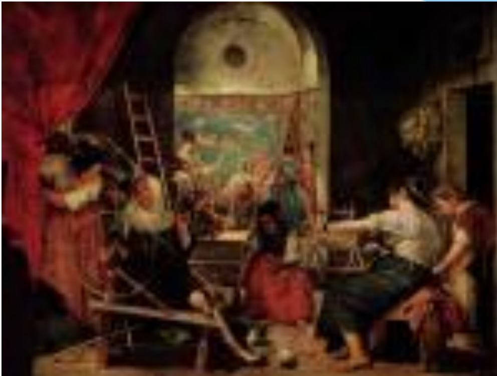
Пряхи или Миф об Арахне .1657 г.

Картина «Пряхи» показывает женщин, занятых тяжёлым повседневным трудом – прядением. На заднем плане полотна старинные костюмы, висящий гобелен и музыкальные инструменты. Общим элементом в картине является свет, луч которого пронизывает слева сверху всю картину. На заднем плане изображён сюжет мифа об Арахне, которая превзошла богиню Афины в мастерстве. Вызов богам опасен.