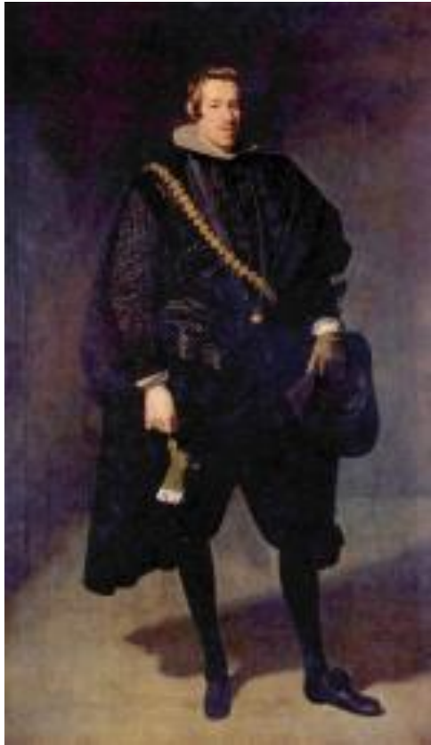
Портрет инфанта дона Карлоса.1828

В марте 1617 года Веласкес закончил обучение в мастерской Франсиско Пачеко и получил звание художника. В 1618 году он обвенчался с дочерью своего учителя Хуаной де Миранда Пачеко. Впоследствии у них родилось двое дочерей, младшая из которых, Игнасия, умрёт ещё во младенчестве. Когда художнику было 24 года, он переезжает с семьёй в Мадрид по приглашению самого короля Филиппа IV. Веласкес стал не только художником короля, но и всего королевского двора, включая даже шутов. Он очень богат и счастлив. На данном портрете фигуру инфанта художник поместил в пустом пространстве. Принцу не на что опереться в буквальном смысле этого слова. Собственная тень преследует Карлоса подобно призраку.