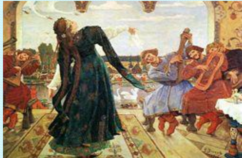
Рис. 3. Иллюстрация В.М.Васнецова к сказке «Царевна лягушка»

Иллюстрации не самостоятельны и по сюжету, они должны соответствовать содержанию литературного произведения.