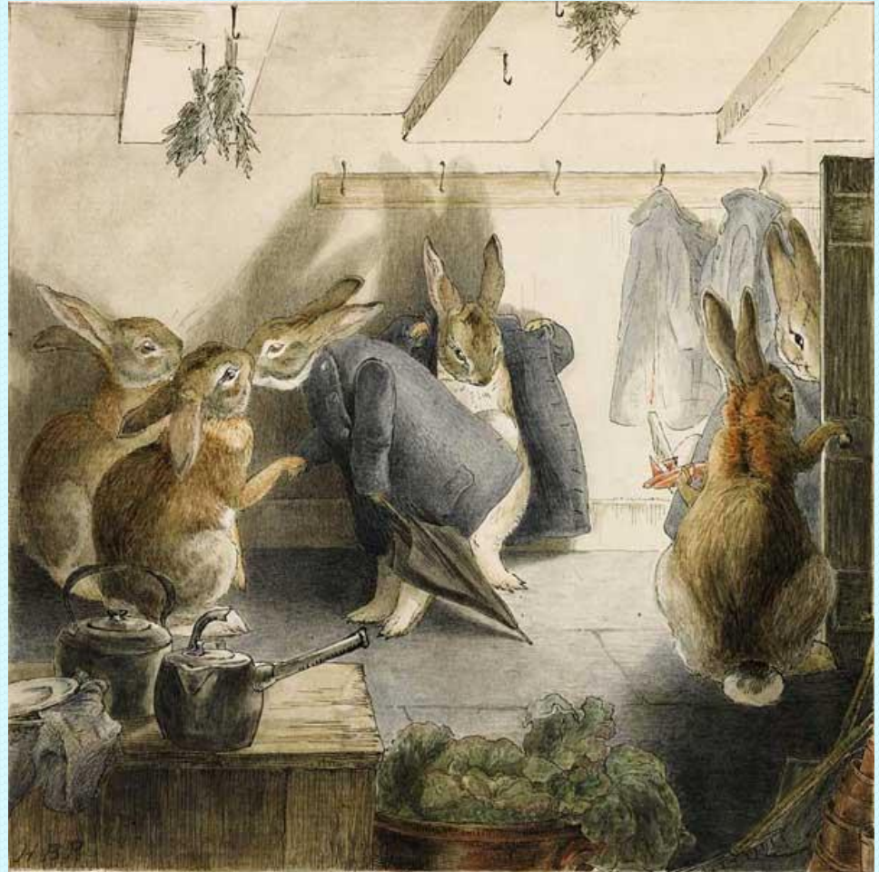
Рис. 7. Иллюстрация к книге Биатрис Поттер «Кролики»