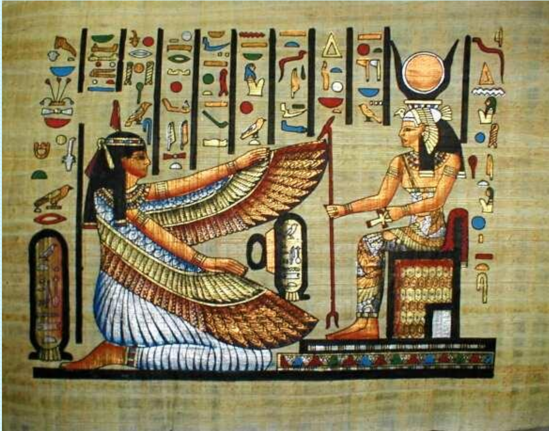
Рис. 1. Папирус с надписями и их иллюстрациями

Сохранились античные образцы первых веков нашей эры а также иллюстрации в византийских, средневековых рукописях.