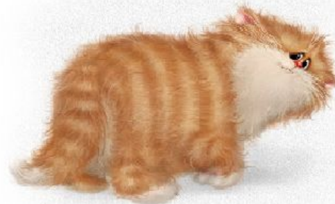
Рис. 6. Готовая работа

Что за зверь со мной играет? НЕ мычит, не ржёт, не лает, нападает на клубки, прячет в лапки когти.