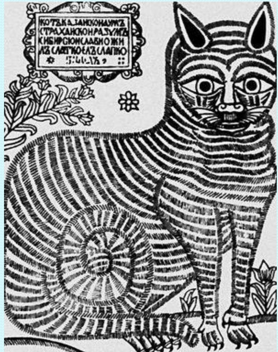
Рис. 2. Страница из старинной книги

Иллюстрации к литературному произведению вместе с ним представляют собой единое целое.