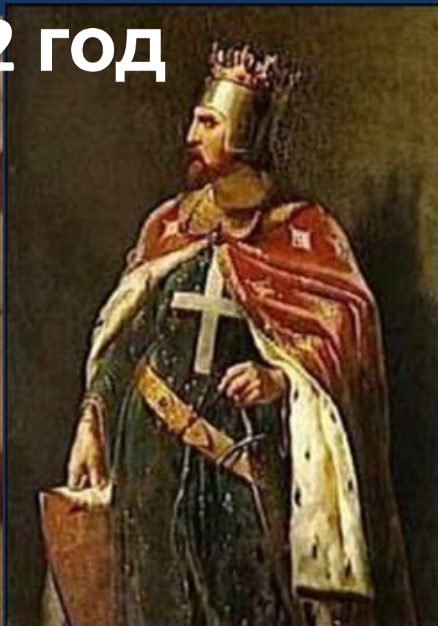
Ричард I Львиное Сердце