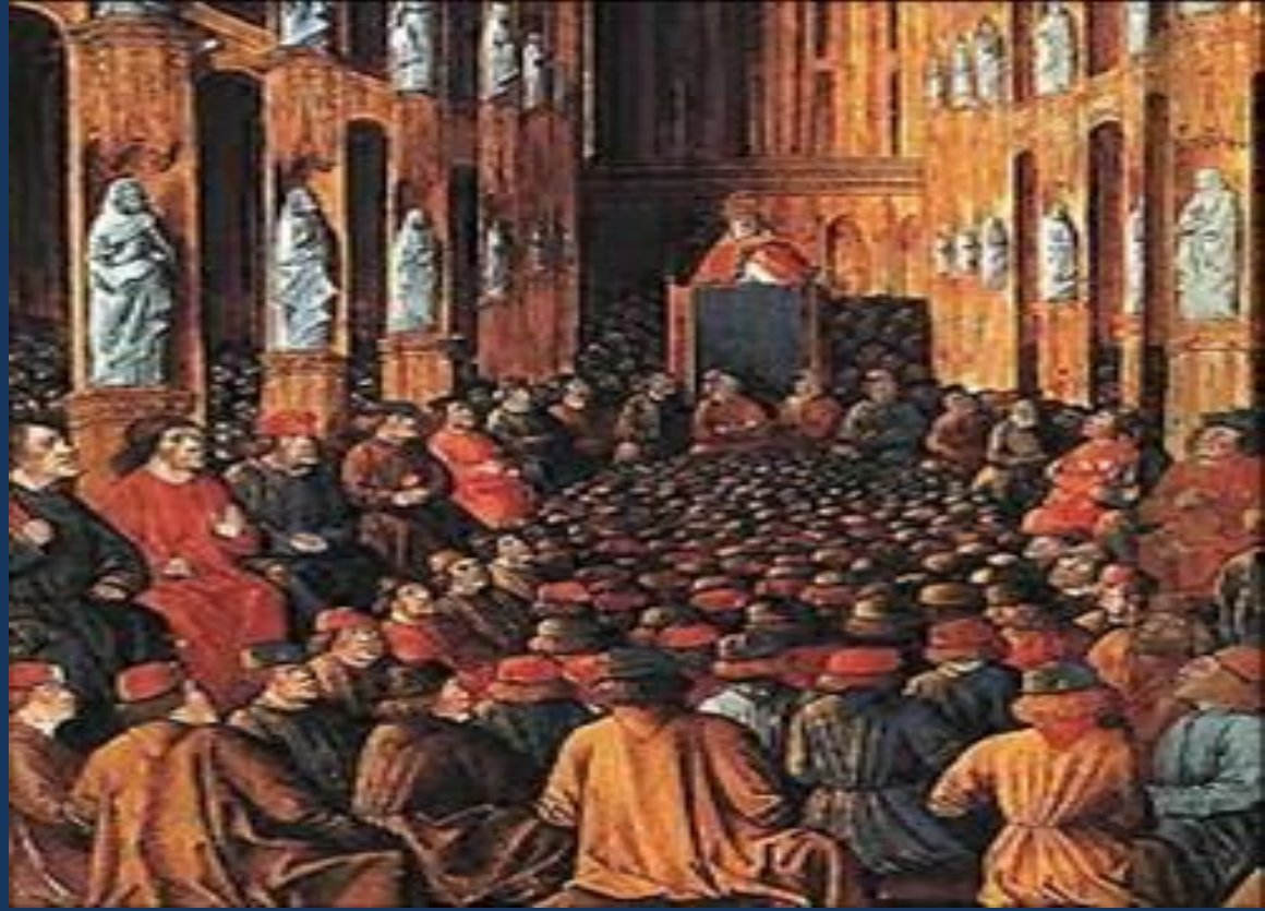
Урбан II (1035/1042 – 1099) Папа римский

Крестовые походы — походы европейцев в Святую Землю с целью освободить христианские святыни или помешать мусульманам вновь их захватить; Крестоносцы — участники Крестовых походов.