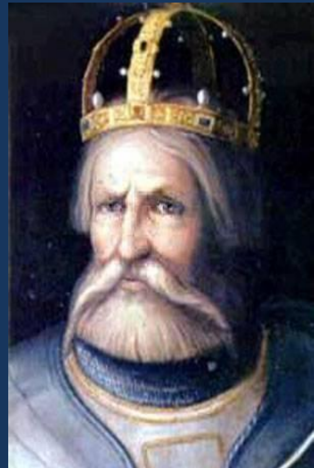
Фридрих I Барбаросса