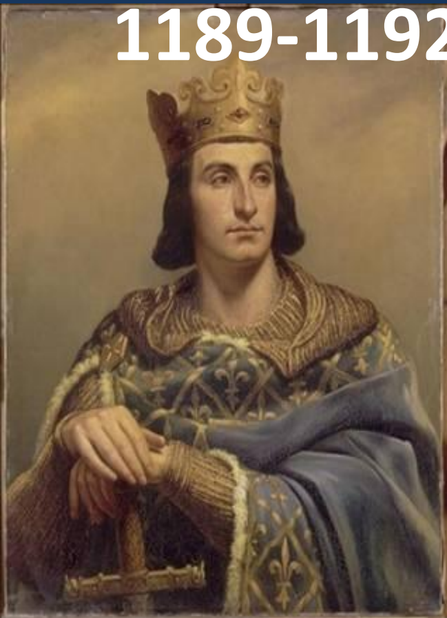
Филипп II Август