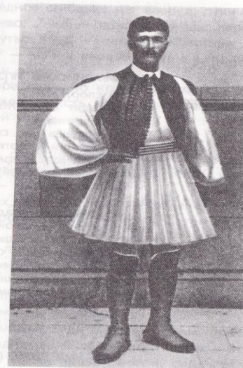
Греческий бегун Спирос Луис — победитель в марафоне на Играх I Олимпиады