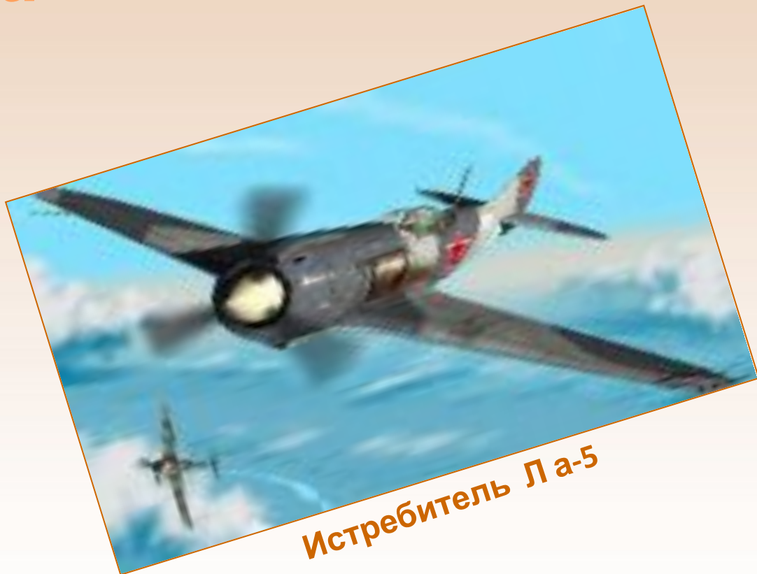
Истребитель Л а-5