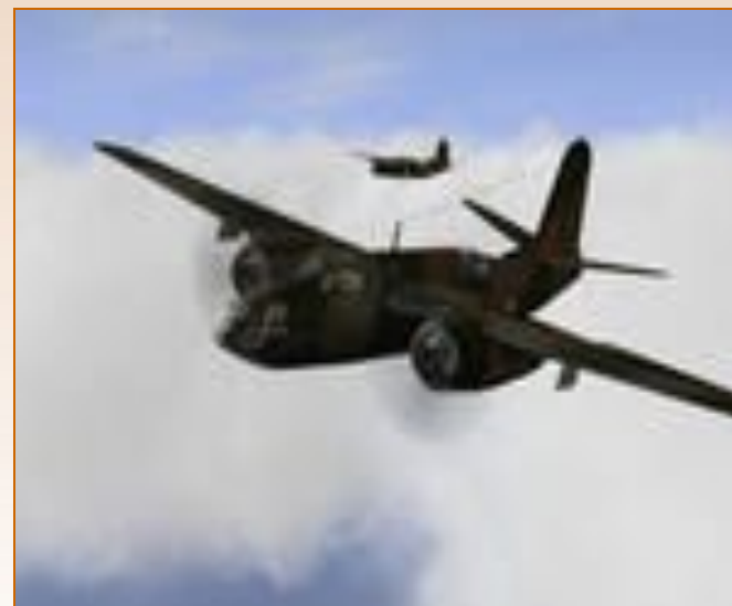
Штурмовик Ил-2. «Самолет-солдат», «летающий танк»