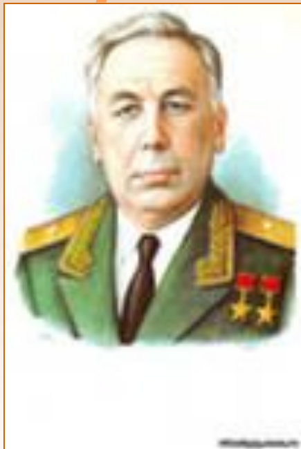
Семен Алексеевич Лавочкин