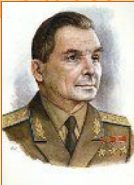
С. В. Ильюшин