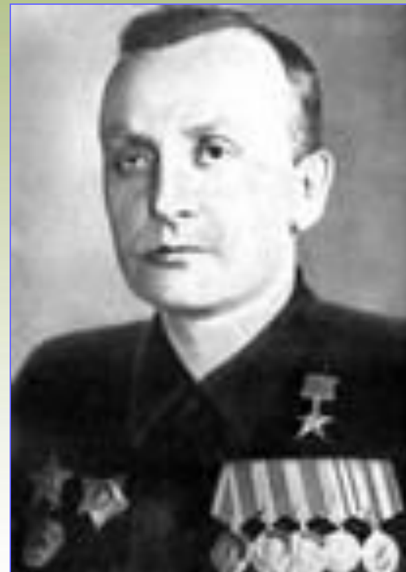
Георгий Семенович Шпагин