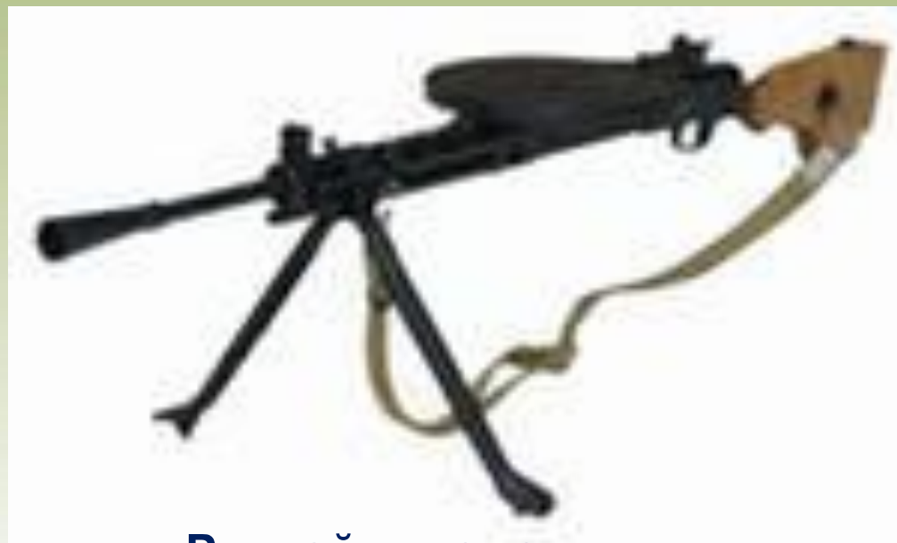
Ручной пулемет Дегтярева