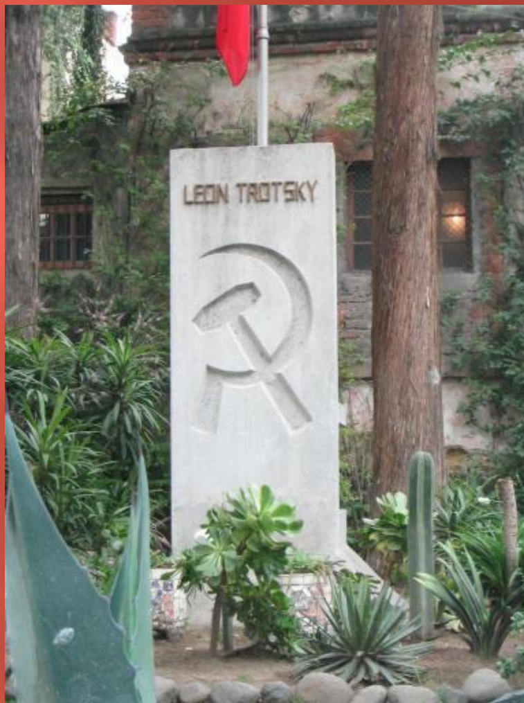
Могила Троцкого в Койоакане, Мексика