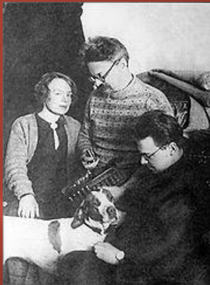
Троцкий в ссылке в Иркутской губернии. 1900

В 1907 году был осуждён на вечное поселение в Сибирь с лишением всех гражданских прав. По пути в Салехард бежал.