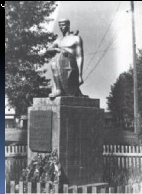
Памятник павшим в Троицке