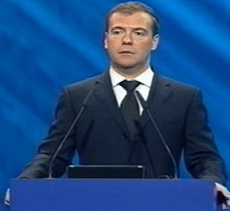
Президент Российской Федерации Д.А. Медведев