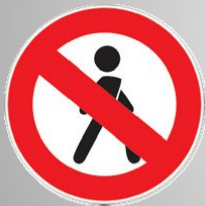
Движение пешеходов запрещено