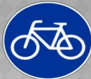
Разрешается ездить велосипедистам