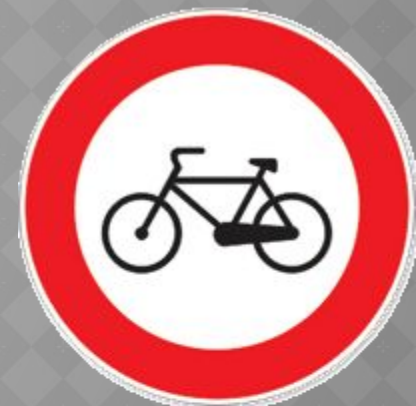
Ездить на велосипеде запрещено