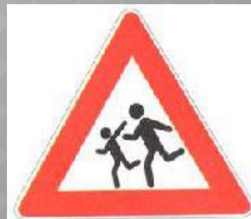
Водитель, внимание! Дети!