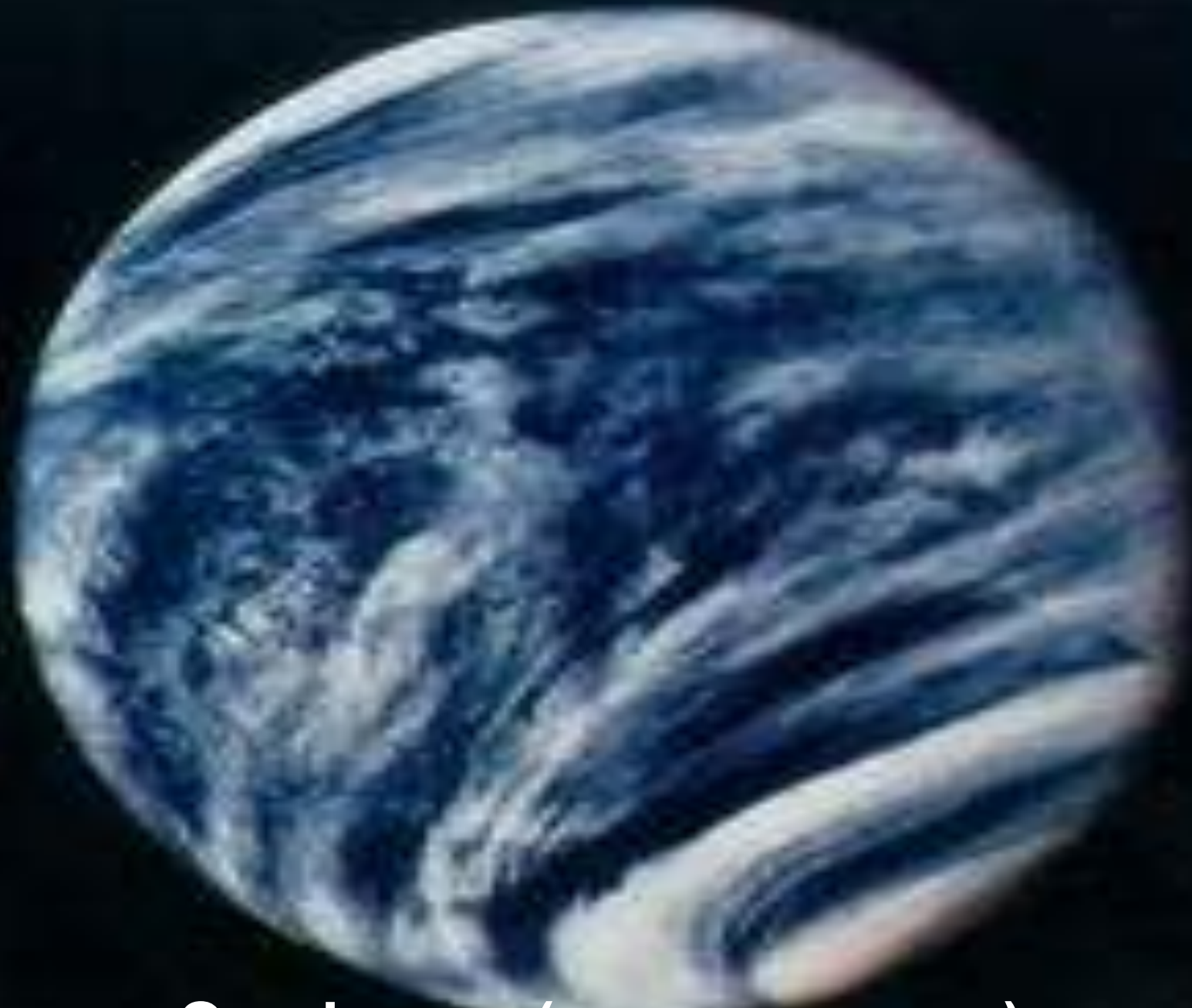
Венера - Эосфорос (несущая утро)