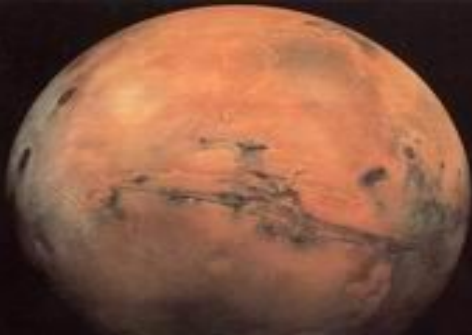
Марс- Пира (огненный, пламенный)