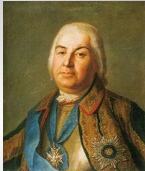
Художник Пьетро Ротари, 1760 год

С 1729 года владельцем усадьбы стал будущий фельдмаршал Петр Семенович Салтыков.