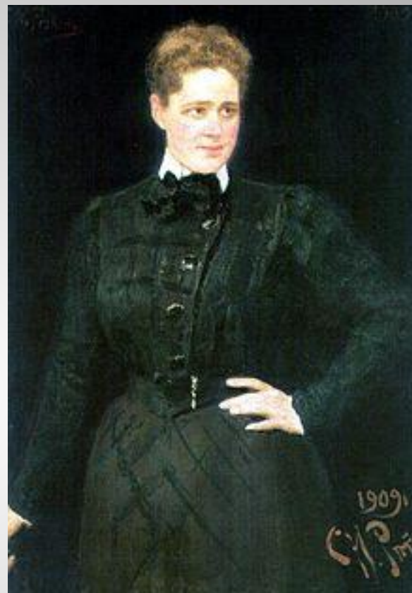
Художник И. Репин, 1909 год

В 1900 г. имение переходит во владение Софьи Владимировны – правнучки С.В. Паниной. Новая хозяйка из старинного рода была одной из самых богатых и знатных женщин России.