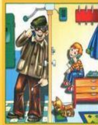
Не разговаривай и не открывай дверь незнакомым людям