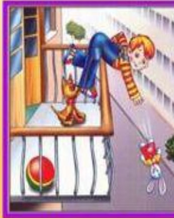
Не играй на балконе, упадешь