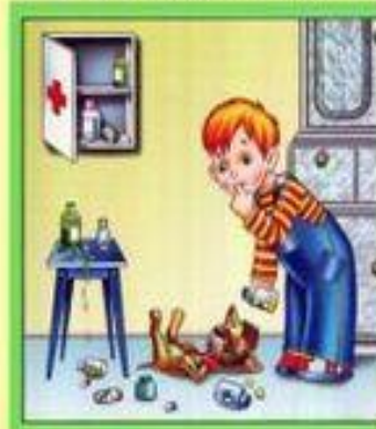
Не трогай таблетки