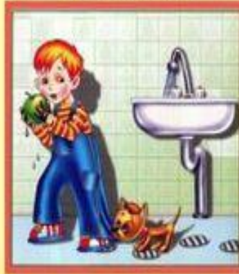
Мойте руки перед едой