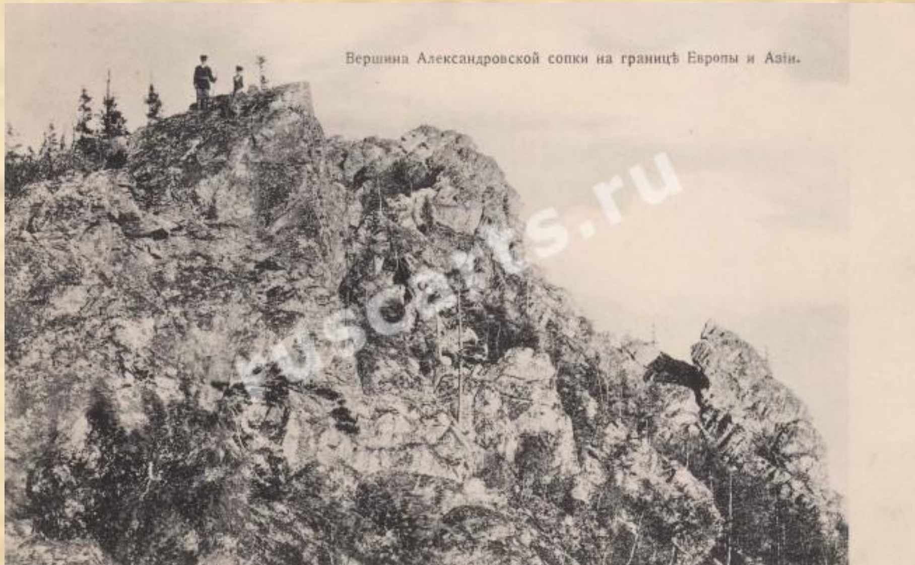
Вершина Александровской сопки на границѣ Европы и Азии.