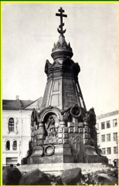
Часовня павшим в боях за Плевну (архитектор В.О. Шервуд), г.Москва