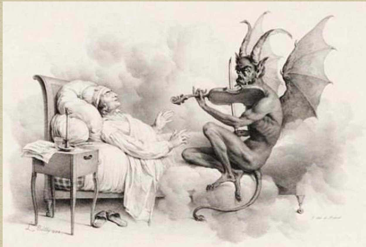
Соната «Трели дьявола»