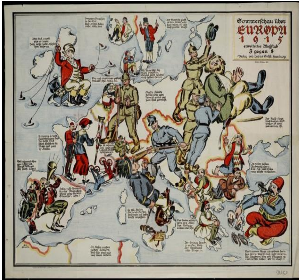
Карикатурная карта Европы начала 20 века

К войне привели противоречия между двумя блоками держав: Великобритания, Франция, Россия, США и их союзники (Антанта) с одной стороны, и Германия, Австро-Венгрия и их союзники (Четверной союз) с другой. Причиной были несогласие двух блоков стран в территориальных претензиях как в Европе, так и в колониях. Ставкой в борьбе держав было мировое господство одного из блоков.