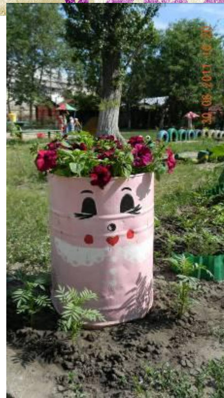
Клумба « Сладкая парочка»