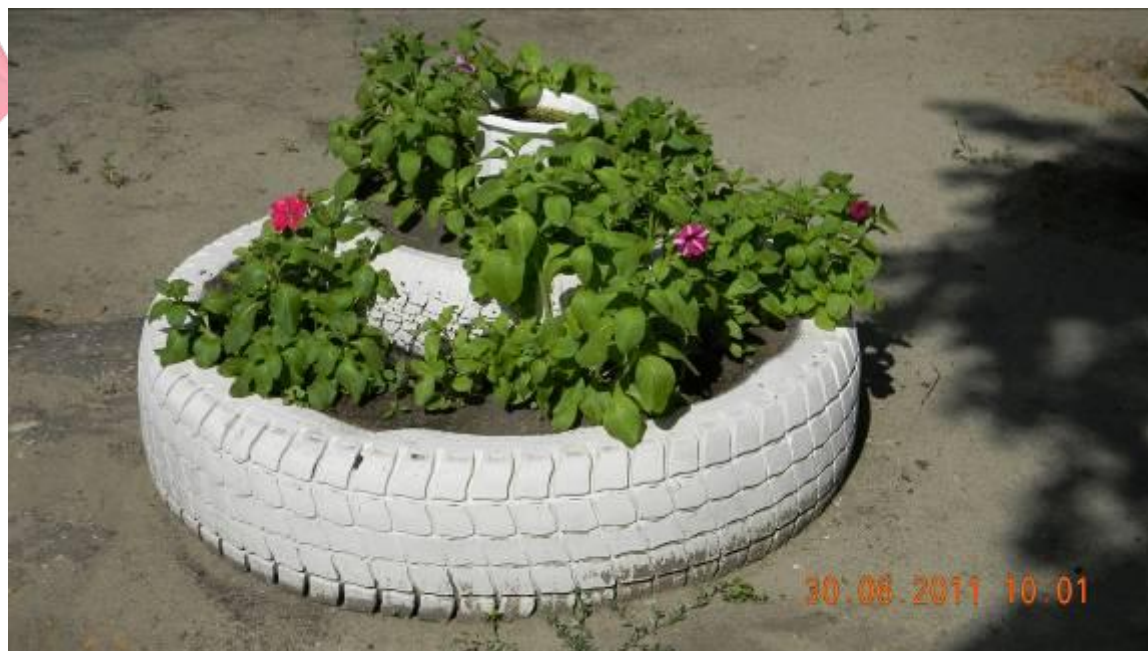
Трехъярусная клумба. Просто и оригинально.