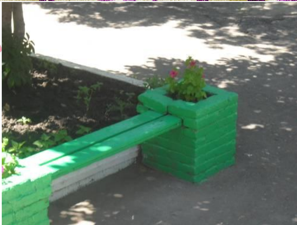
Скамейка – клумба.