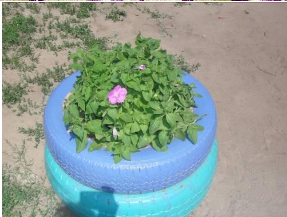
Круглые клумбы на участке детского сада