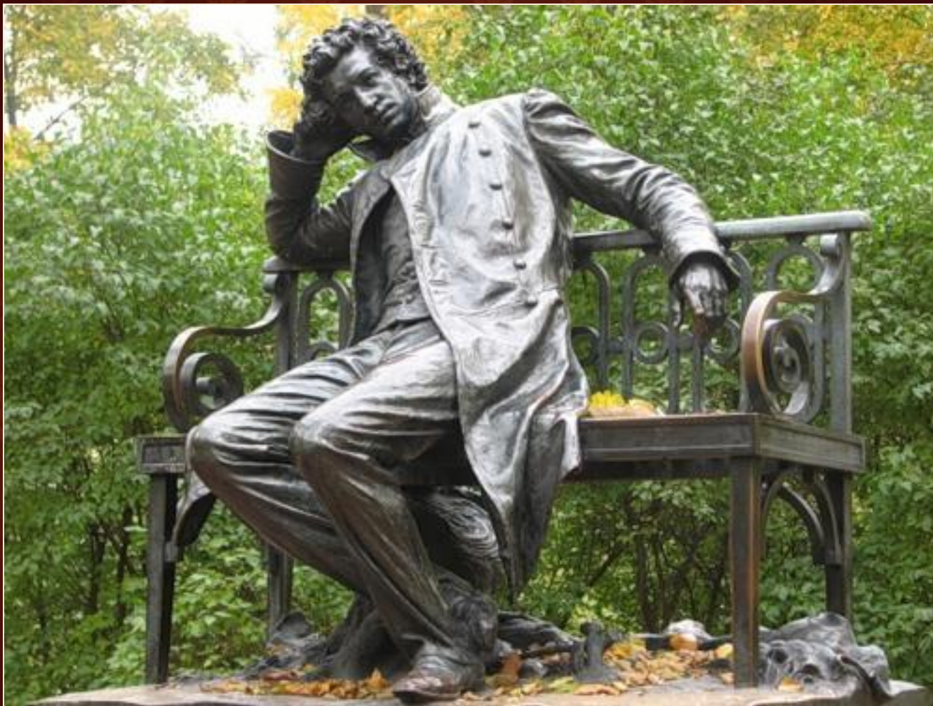
Памятник А.С.Пушкину в Царском Селе