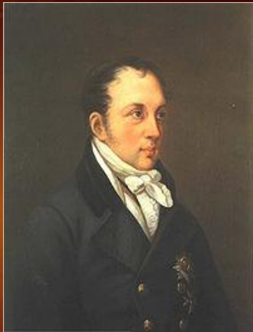
Энгельгардт Е.А., директор Лицея с 1814