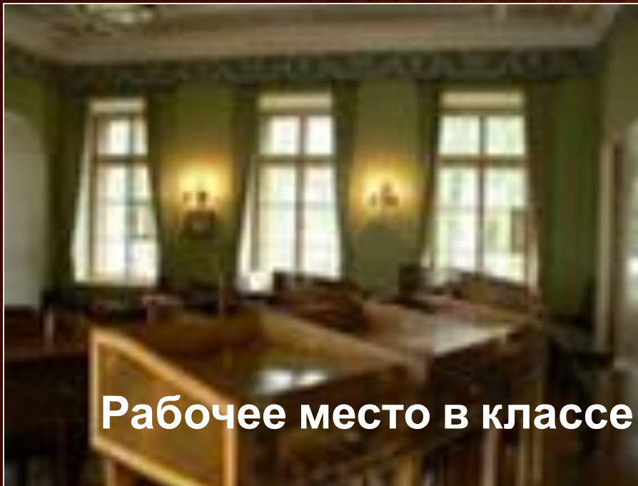
Рабочее место в классе