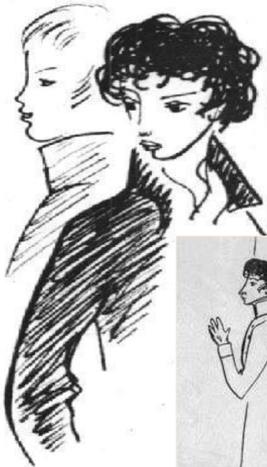
Пушкин и Дельви́г