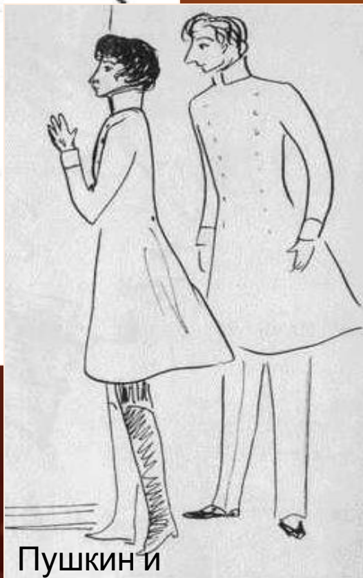
Пушкин и Кюхельбекер