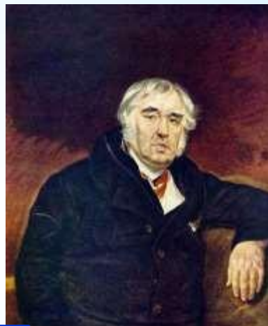
2 Крылов И.