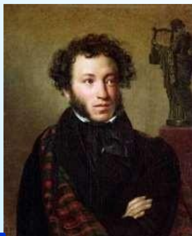
3 Пушкин А.