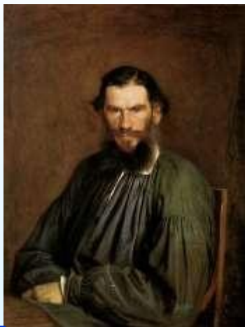
4 Толстой Л.

Напиши фамилии писателей в алфавитном порядке.