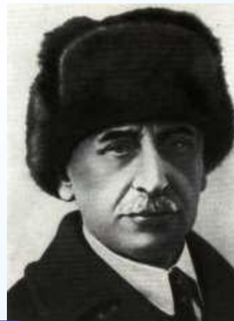
1 Житков Б.