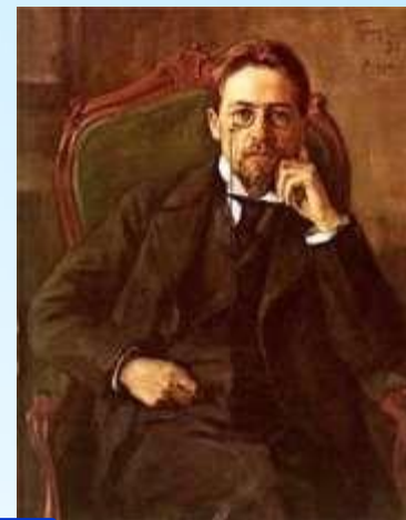
5 Чехов А.