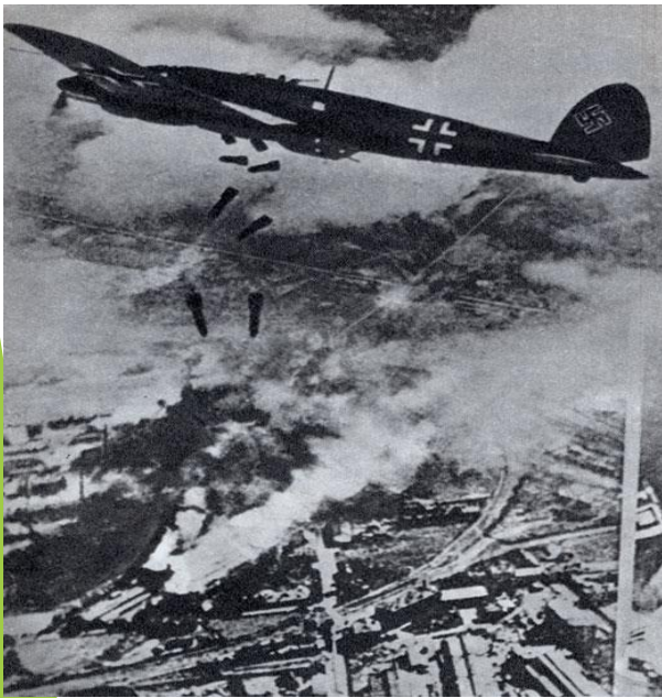
Немецкие самолеты бомбят Брянщину