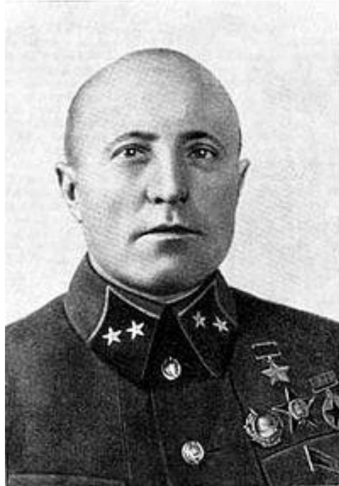
генерал-майор Михаил Петрович Петров

Наступление танковой группы Гудериана с левого фланга обеспечивали части 47-го мотомеханизированного корпуса. В первые дни после захвата Рославля немецкими войсками они не встречали к югу от города серьезного сопротивления, поскольку советских войск здесь почти не было. Наиболее уязвимым направлением было шоссе Рославль-Брянск. Сюда и стали выдвигаться части 50-й армии, сформированные на территории Брянщины. Армия состояла из девяти дивизий и нескольких отдельных подразделений, была хорошо укомплектована личным составом (средняя численность дивизии составляла 10–12 тысяч человек), артиллерией (кроме противотанковой), пулеметами. Однако в ее составе было мало зенитных средств, не хватало автотранспорта, у стрелков почти не было автоматов. Командующим армией был назначен генерал-майор Михаил Петрович Петров, удостоенный за участие в боях в Испании звания Героя Советского Союза. 11 августа и потом еще 16 дней подряд фашистские войска пытались пробиться на этом участке фронта, но все попытки были отбиты с большими потерями для наступавших. Затем немецкое командование попыталось обойти эту позицию с запада и сосредоточило ударную группу у села Белоголовль (Жуковский район), но и эта атака была отбита советскими войсками. В целом же части 50-й армии 59 дней держали этот рубеж обороны, не допустив прорыва противника в сторону Брянска.