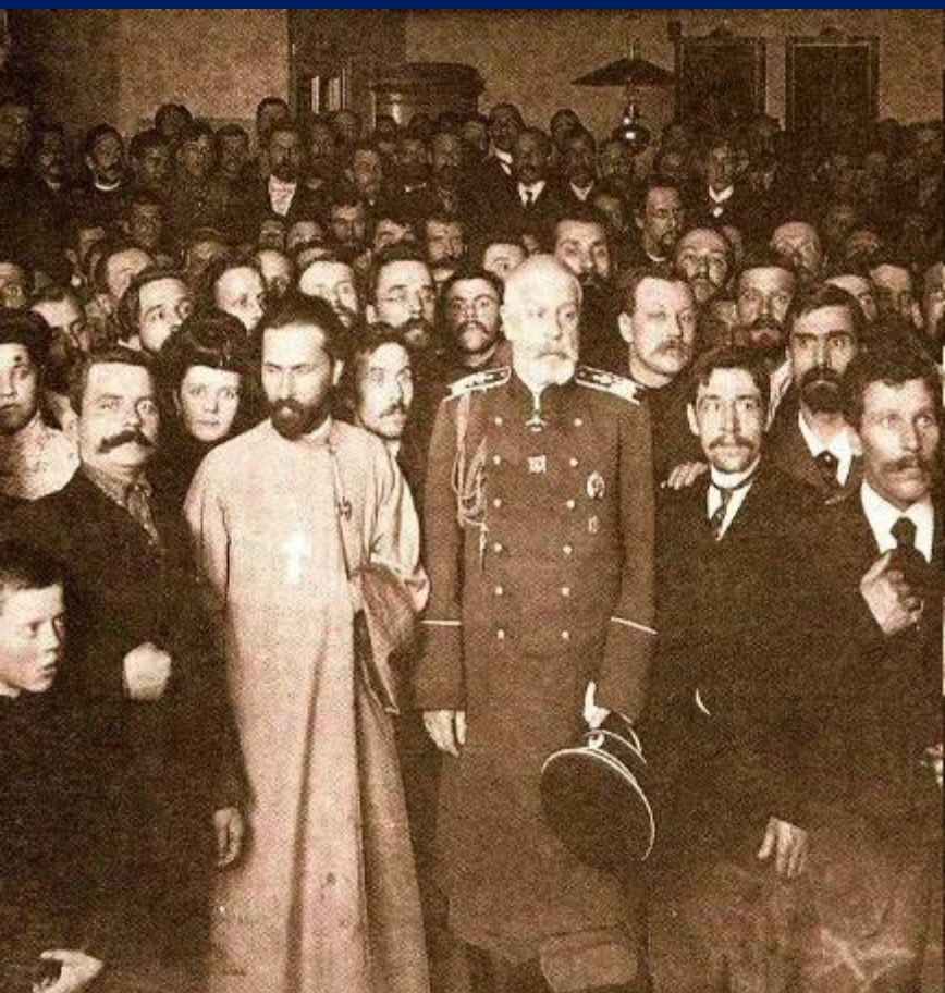
Г. Гапон в «Собрании русских фабрично-заводских рабочих г. Санкт-Петербурга» (27 декабря 1904 (9 января 1905))