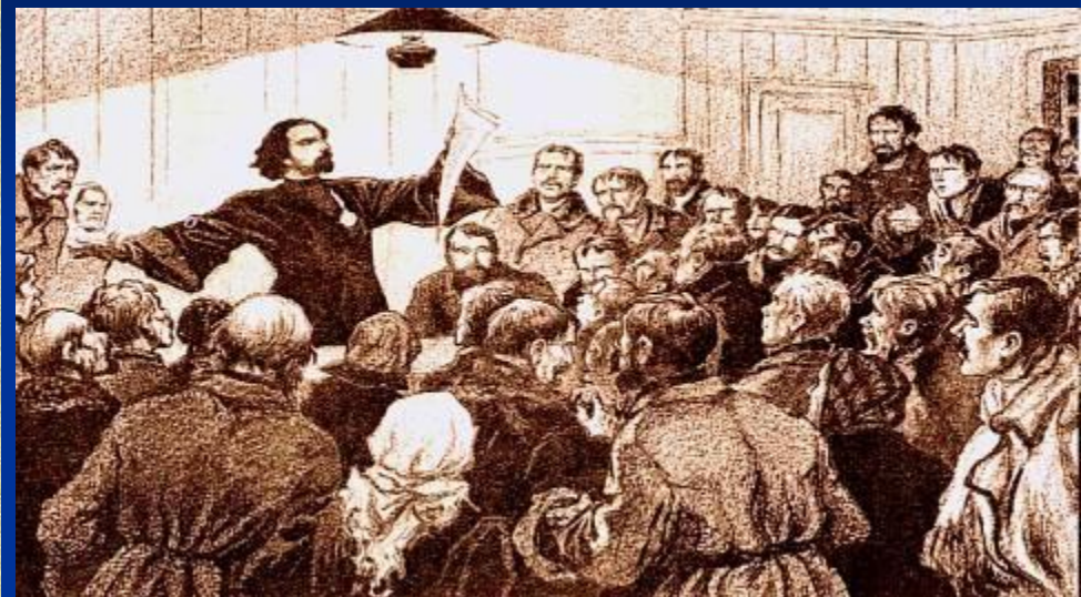
«Гапон читает петицию в собрании рабочих». Рисунок неизвестного художника.

Трудовая Рабочая Петиция. Мы, рабочие в № наших охот, долгов и бедных людей, старших родителей, пришедших к нам, государь, желаем права и свободы Мы хотим, чтоб уважали, обрабатывали людей неоплачиваемых трудов, чтоб наши нагрузки, в нас не признают и бы, к нам отнеслись, как к рабам, которые должны жертвовать собой книжки и мучаешь. Мы и теперь мы, но нас толкают все дальше в силу несправедливости, беззакония и несправедливости. Наша душа, достоинство и честь нам и мы задыхаемся. Наша душа мы, государь. Наступил предельный момент. Если нас признают в этот момент, чтоб не было дальше, чтоб продолжалось не было нашей души. И вот мы хотим своей работы и здоровья наших родственников, что не کنیم работ наше, но мы не исполняем наших требований. Мы хотим наше просим. Мы хотим, чтоб тогда же, как и жизнь, а каторга всегда была. Первая наша просьба была, чтоб наши хозяева виделись с нами, обсудили наши нужды, но и в это мы не откликнулись, нас отказались в правду говорить о нас наше нужды, чтоб, чтоб так привести к нам не признают закон.