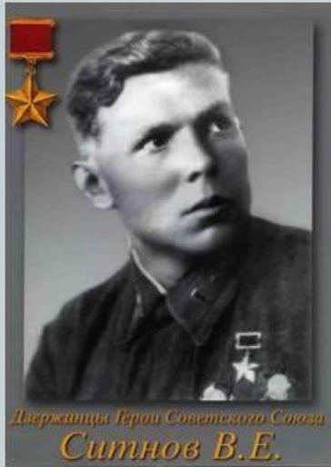
Держинцы Герои Советского Союза Ситнов В.Е.