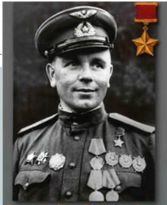
Держинцы Герои Советского Союза Провирнов М.А.