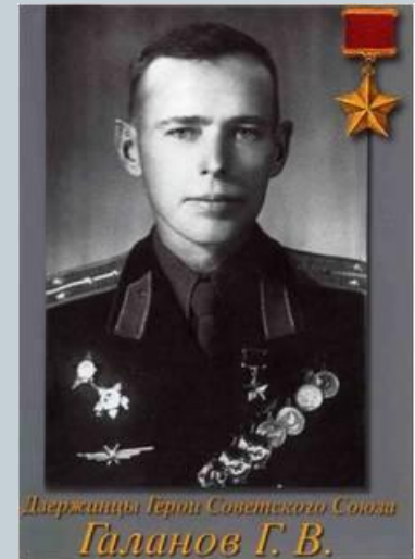
Держинцы Герои Советского Союза Галанов Г.В.