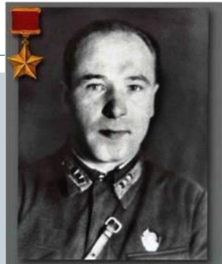
Держинцы Герои Советского Союза Матвеев П.Я.