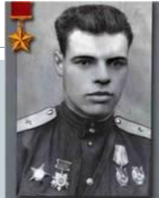
Держинцы Герои Советского Союза Молев А.О.