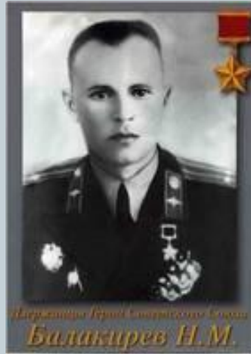
Держинцы Герои Советского Союза Балакирев Н.М.