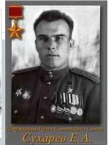
Держинцы Герои Советского Союза Сухарев Е.А.