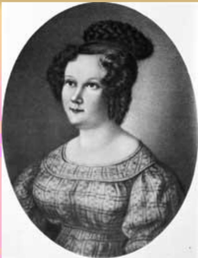
Екатерина Ивановна Трубецкая

Нет! Я не жалкая раба, Я женщина, жена! Пускай горька моя судьба – Я буду ей верна!