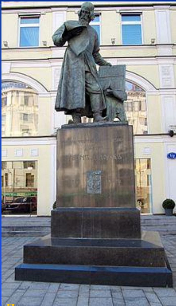
Памятник первопечатнику Ивану Фёдорову в Театральном проезде в Москве