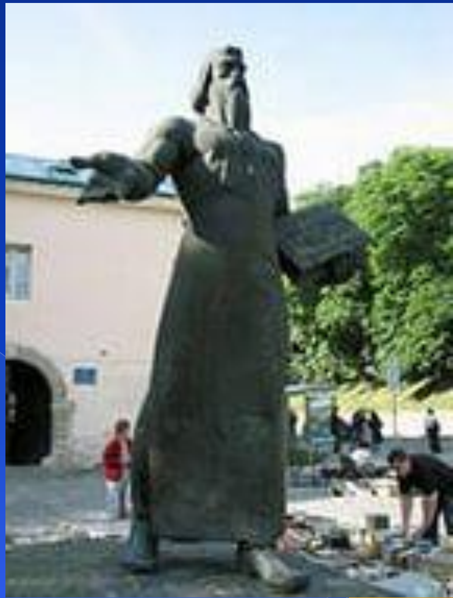
Памятник первопечатнику Ивану Фёдорову во Львове