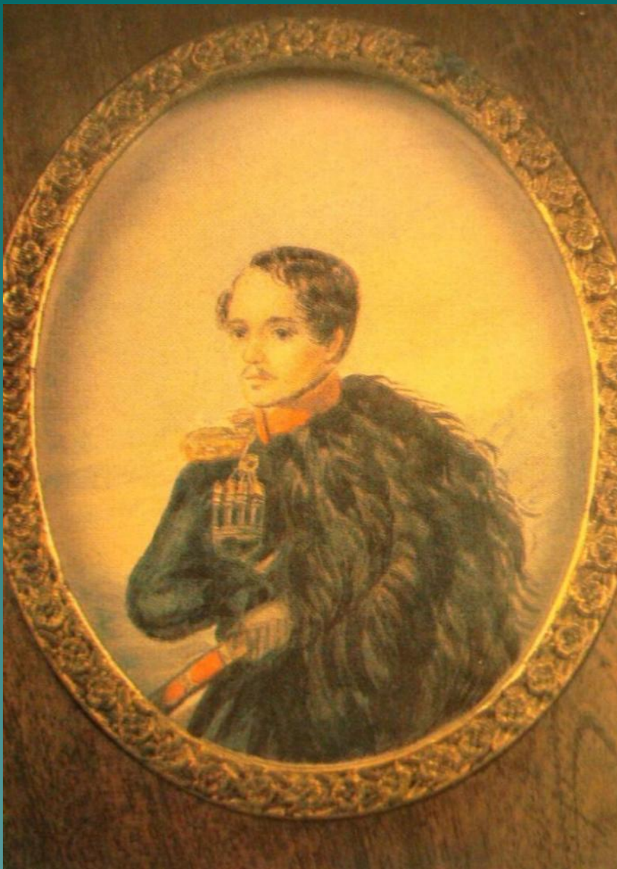
М.Ю.Лер- МОНТОВ. Автопортрет. Акварель. 1837 г.