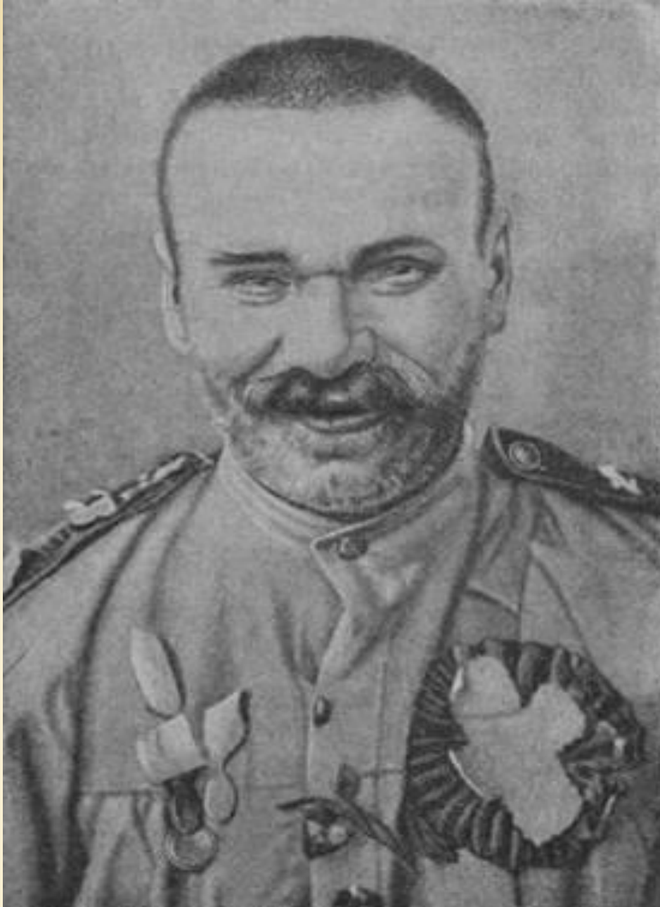
Экспансивная форма СМ Неизвестный больной