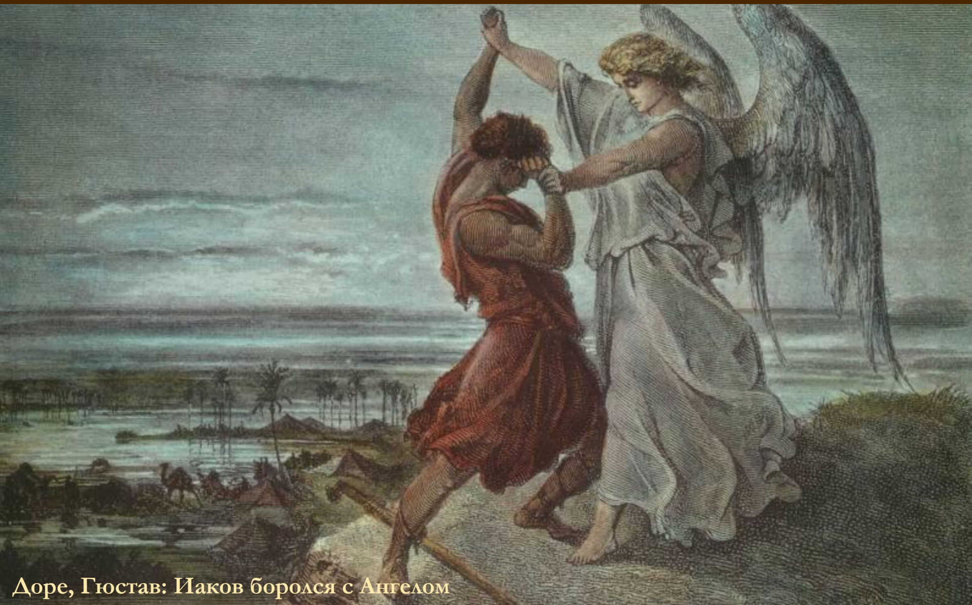
Доре, Гюстав: Иаков боролся с Ангелом