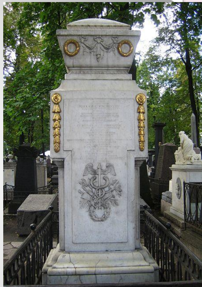
Могила М.В.Ломоносова в Александро – Невской лавре

Я знак бессмертия себе воздвигнул Превыше пирамид и крепче меди, Что бурный Аквилон сотреть не может Ни множество веков, ни една древность. Не вовсе я умру, но смерть оставит Велику часть мою, как жизнь скончаю. Я буду возрастать повсюду славой, Пока великий Рим владеет светом.