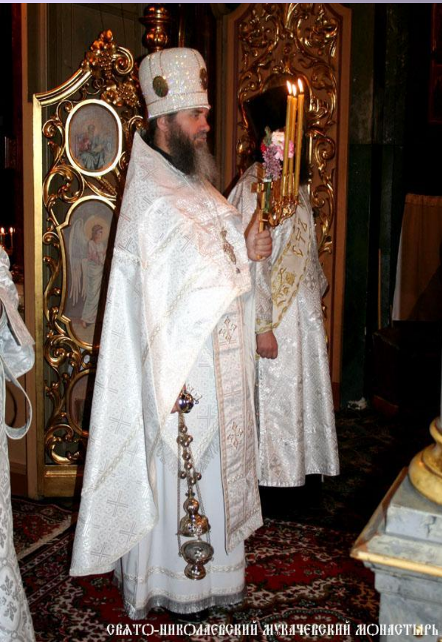
СВЯТО-НИКОЛАЕВСКИЙ МУЖАЧЬЕВСКИЙ МОНАСТЫРЬ