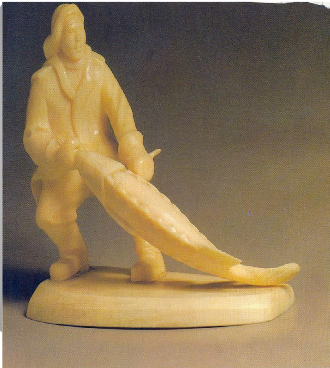
Д.М. Шушкано в «Рыбак с осетром» Зуб кашалота.