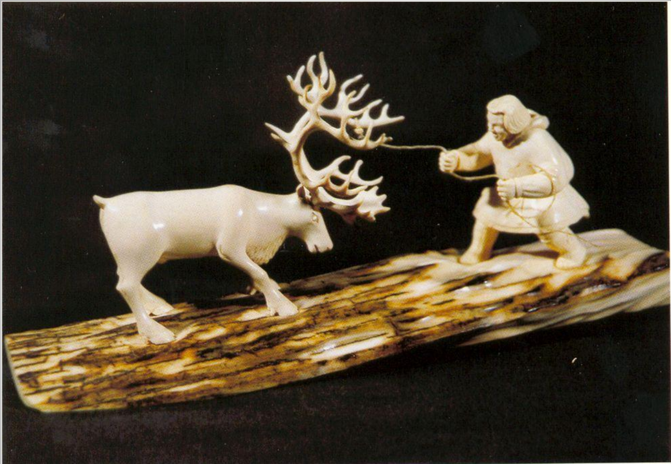
А. Куделин «Отлов» Бивень мамонта.