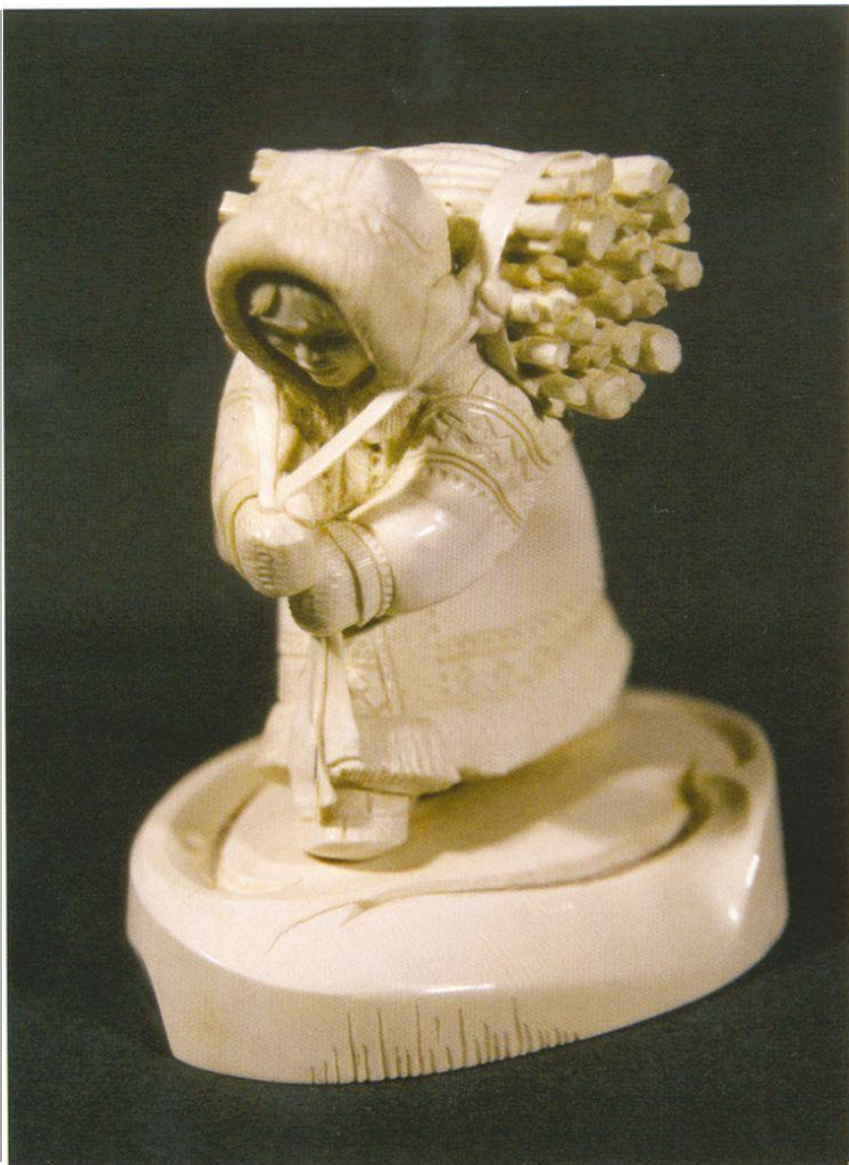
Е. Аляба «Из леса», бивень мамонта