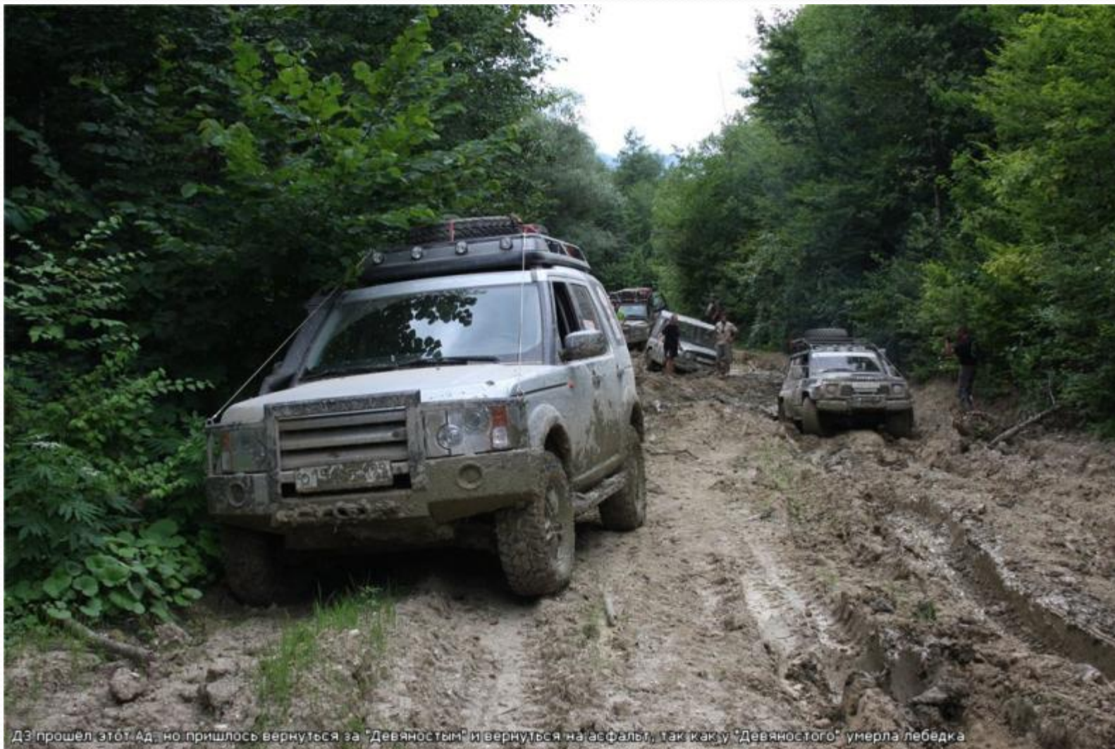
ДЗ прошел этот Ад, но пришлось вернуться за "Девяностым" и вернуться на асфальт, так как у "Девяностого" умерла лебедка