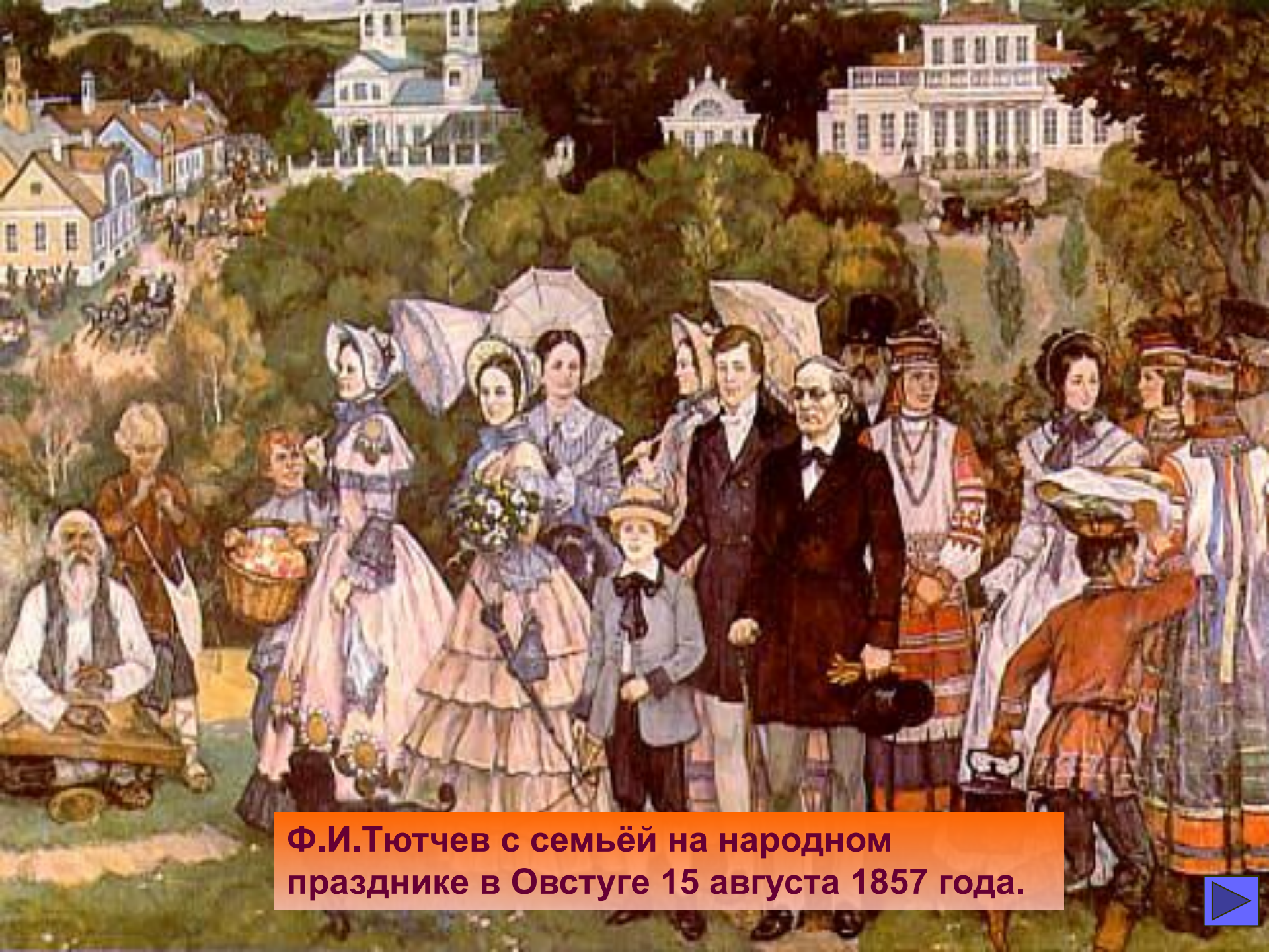
Ф.И.Тютчев с семьёй на народном празднике в Овстуге 15 августа 1857 года.