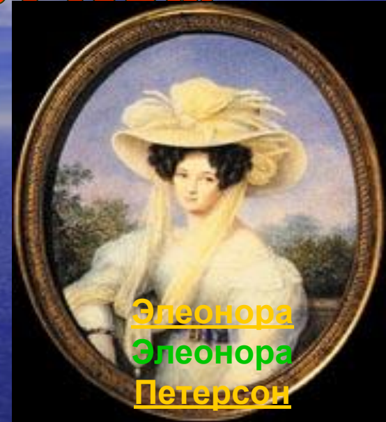
Элеонора Элеонора Петерсон