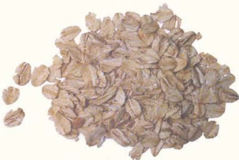
Овсяные хлопья (геркулес)