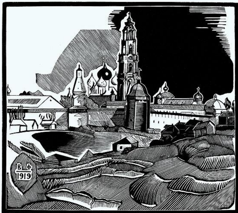
Троице-Сергиева Лавра. 1919 г.