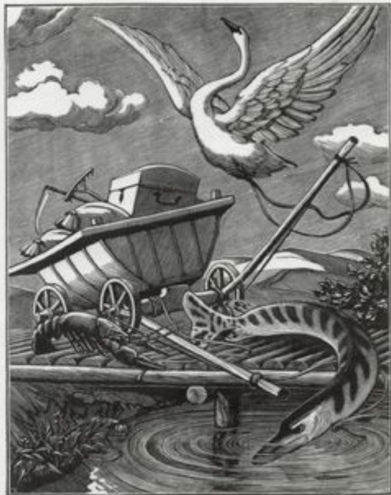
Illustration of a swan flying over a boat on a raft, with a large fish leaping from the water.