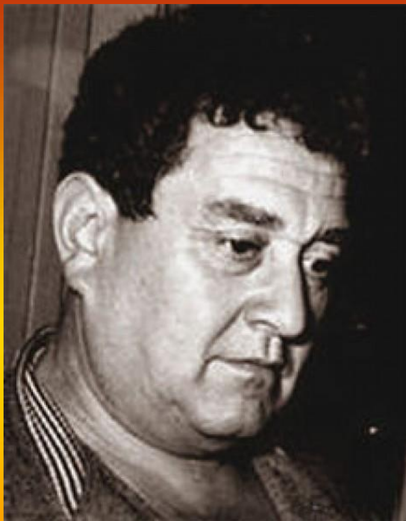
Драгунский Виктор Юзифович