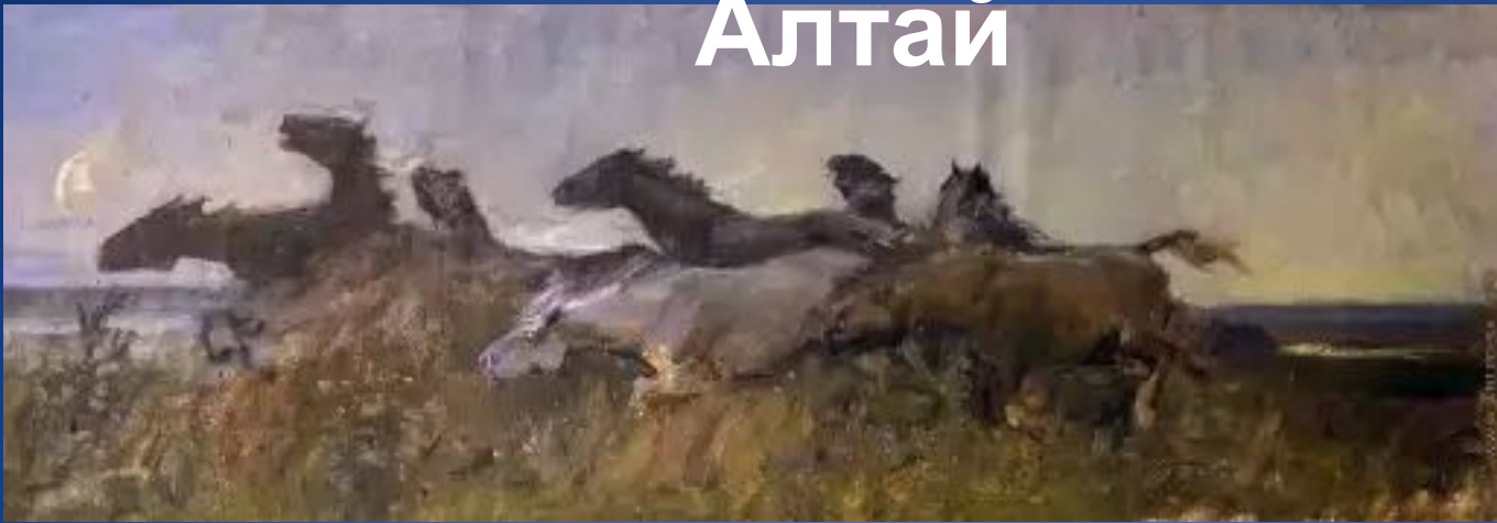
Горный Алтай. Табун. (1954г.)