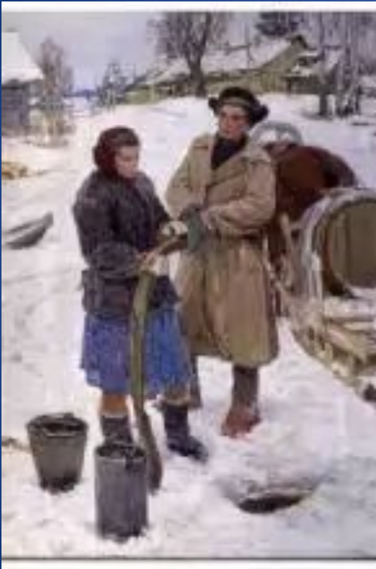
По воду. ( 1950г.)