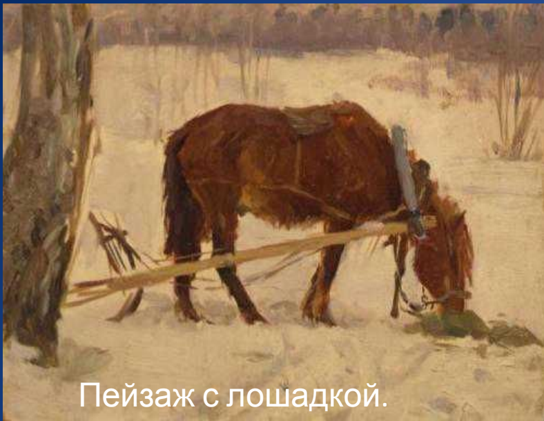
Пейзаж с лошадкой. (1957г.)