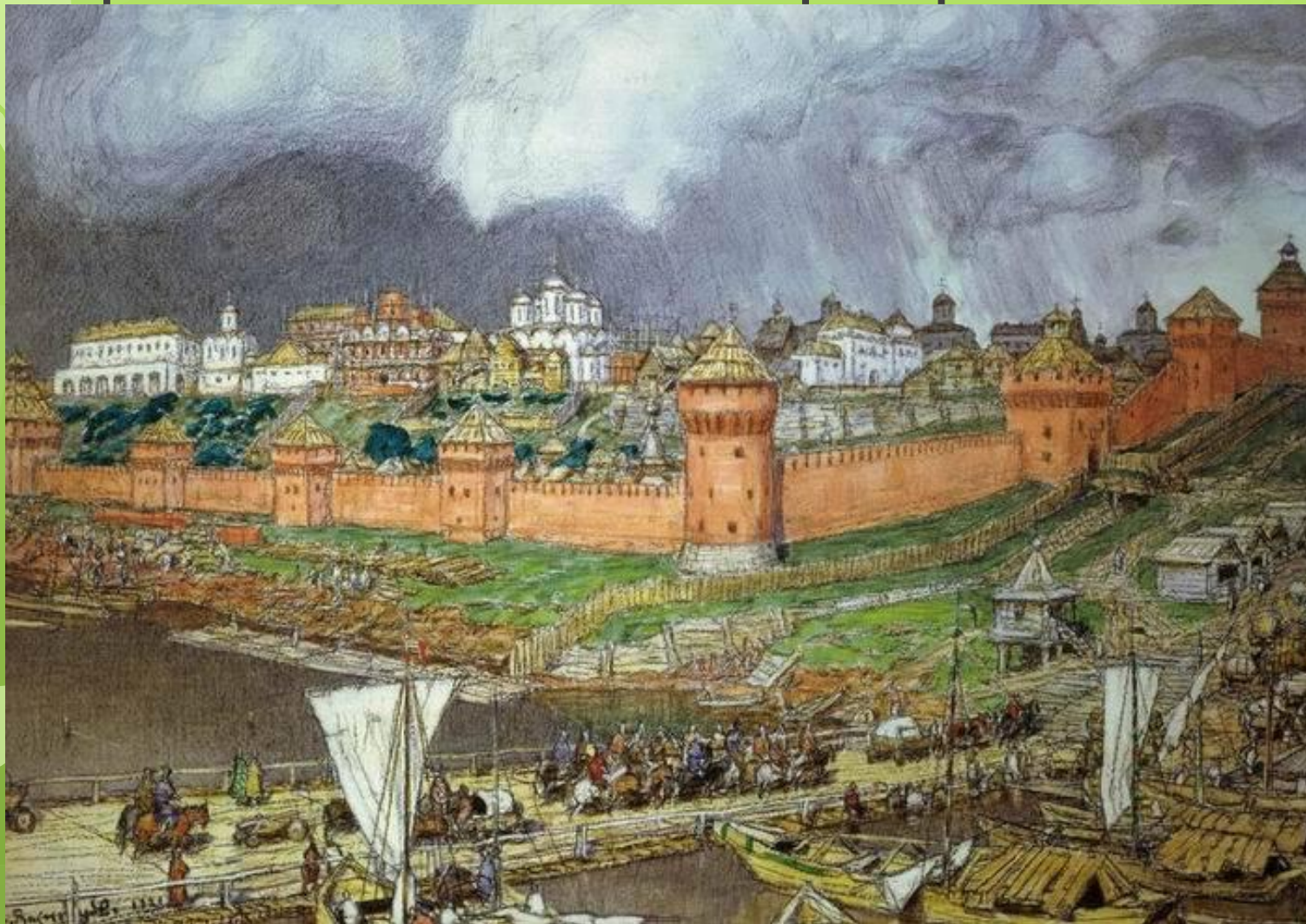
А.М.Васнецов. Кремль, XVI век.

Найдите описание Москвы в тексте романа «Князь Серебряный»