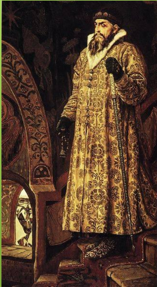
В.М.Васнецов. «Царь Иван Грозный» (1530-1584)