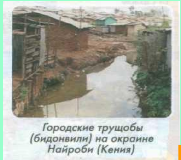
Городские трущобы (бидонвили) на окраине Найроби (Кения)

Ложная или трущобная урбанизация – резкое увеличение доли городского населения в развивающихся странах за счет притока сельского населения и образования вокруг крупных городов стихийных поселений, лишенных инфраструктуры.