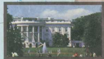
Белый дом — резиденция президента США в Вашингтоне

ЗАДАНИЕ 6. Найди эти мегалополисы на карте. Нанеси их на контурную карту.