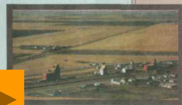
Типичный пейзаж в «пшеничном поясе» США