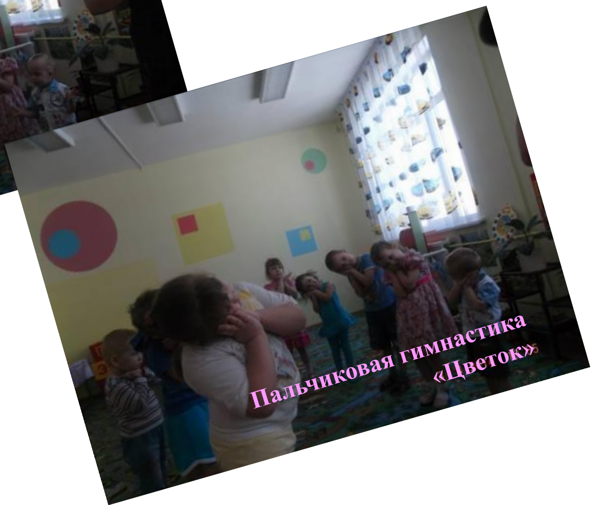
Пальчиковая гимнастика «Цветок»