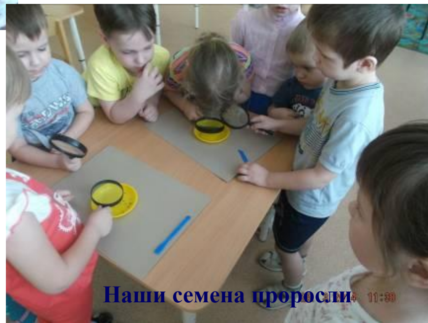
Наши семена проросли 31.10.2014 11:39