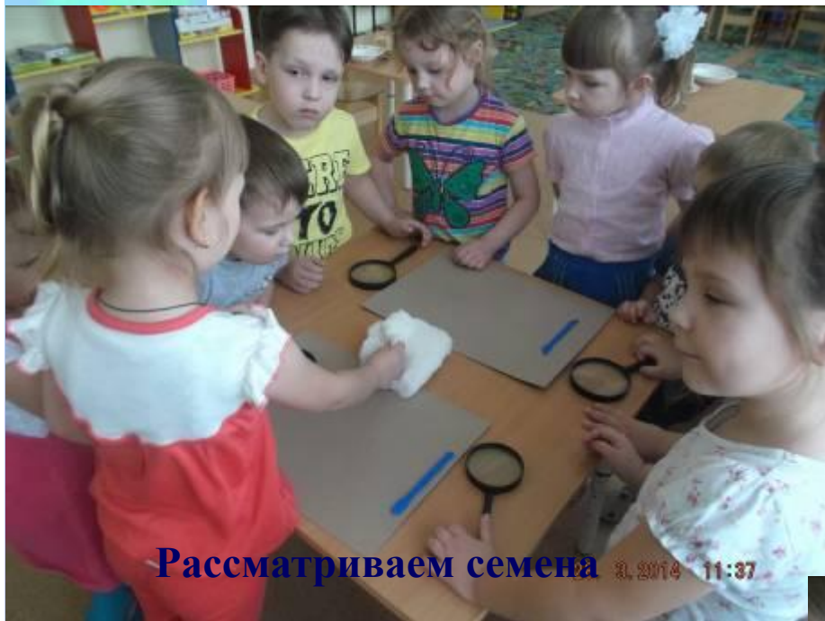
Рассматриваем семена 31.10.2014 11:37