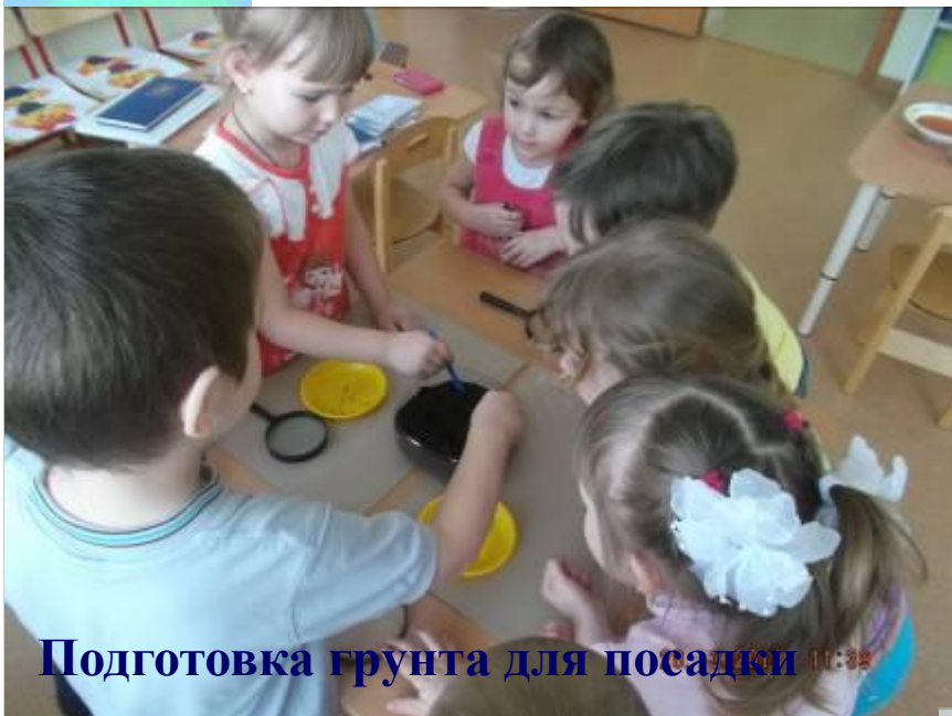
Подготовка грунта для посадки 09.04.2016 10:35