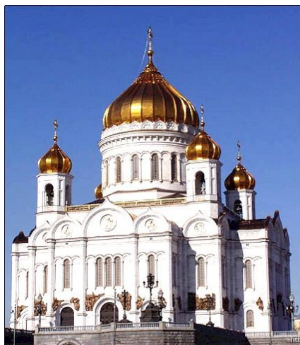
Храм Христа Спасителя