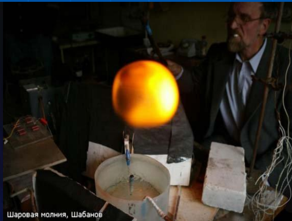
Шаровая молния, Шабанов