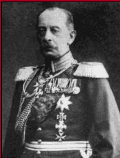
Альберт фон Шлиффен

К разработке плана немецкие военные приступили еще в 1895 году. План был построен на том, что России потребуется для мобилизации не менее 105-110 дней , а немецкой и австрийской армиям не более 14 дней . Это обеспечивало возможность нанести поражения Франции до того как Россия сумеет оказать ей существенную помощь.