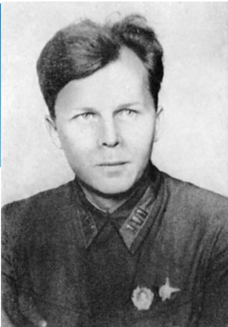
Александр Твардовский. 1942 год.