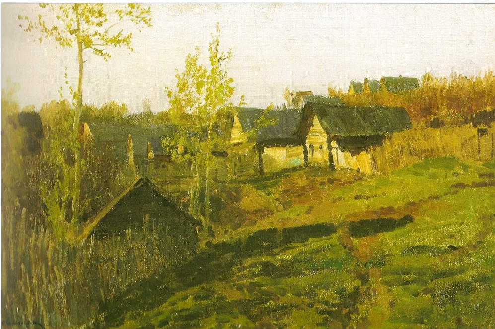
«Деревня. Серый день».