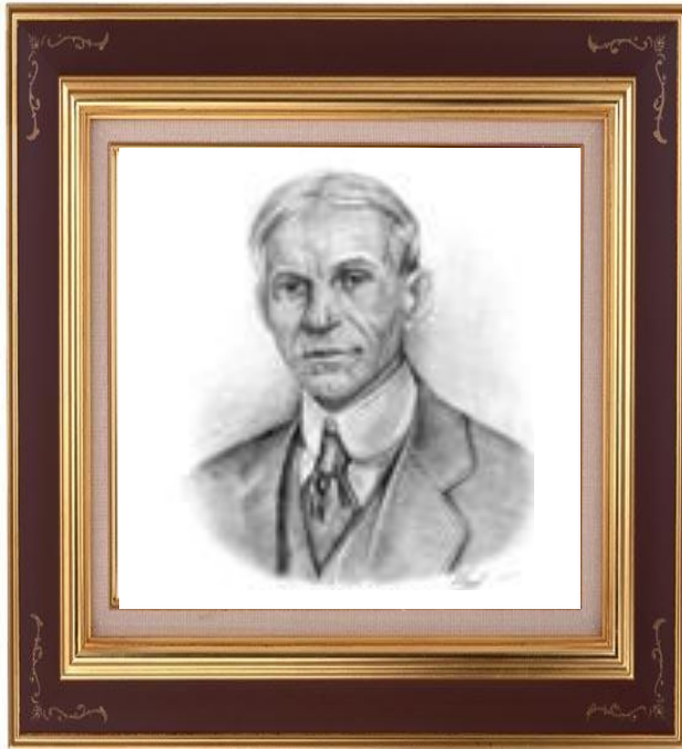
Генри Форд Henry Ford 1863-1947