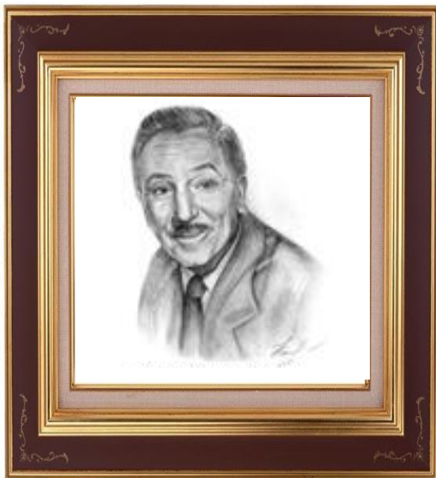
Уолт Элиас Дисней Walt Elias Disney 1901 – 1966