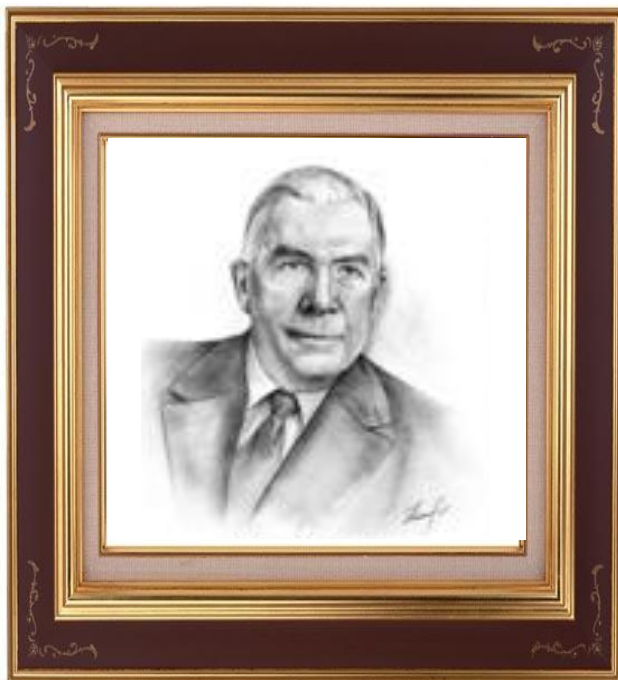
Пол Галвин Pol Galvin 1895 – 1959