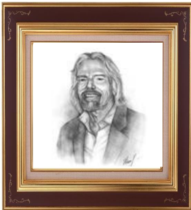
Ричард Чарльз Николас Брэнсон Richard Charles Nicholas Branson 1950