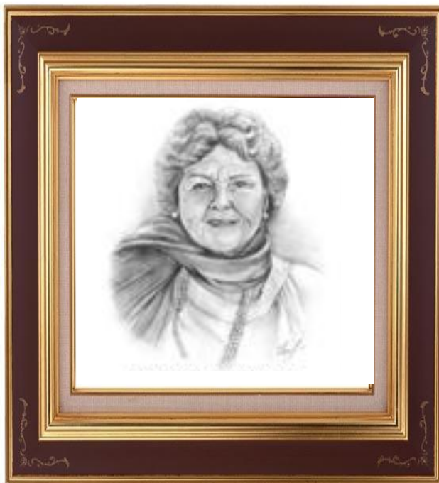
Анна Магдалене Бурда Anne Magdalene Burda 1909 - 2005