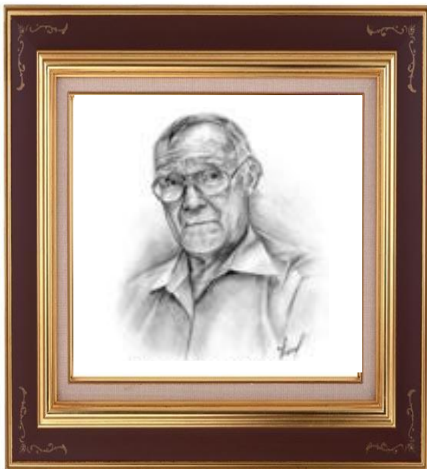
Ингвар Феодор Кампрад Ingvar Feodor Kamprad 1926