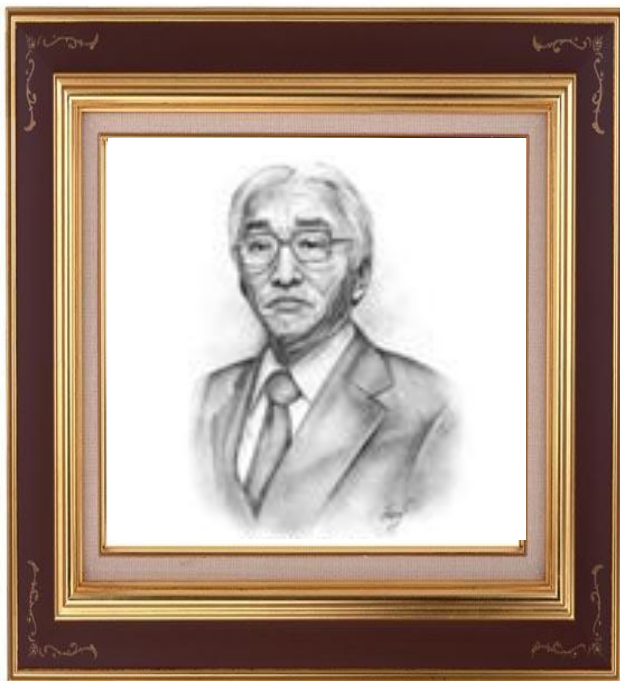
Акио Морита Akio Morita 1921 - 1999