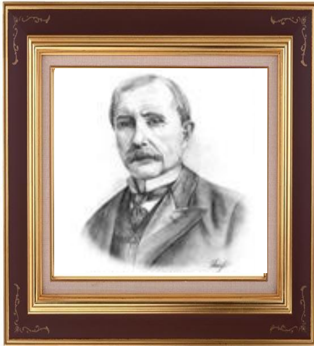
Джон Дэвисон Рокфеллер John Davison Rockefeller 1839 – 1937