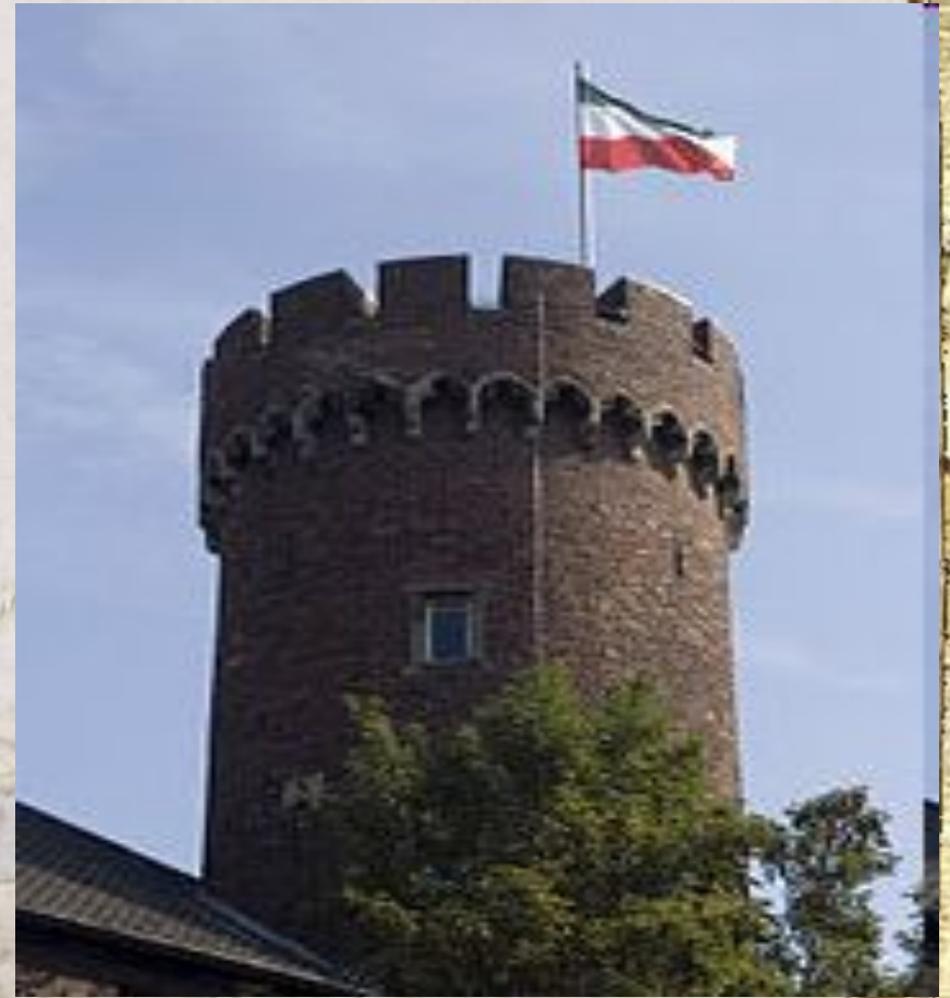
Донжон Кемпенского замка, (Северный Рейн- Вестфалия)